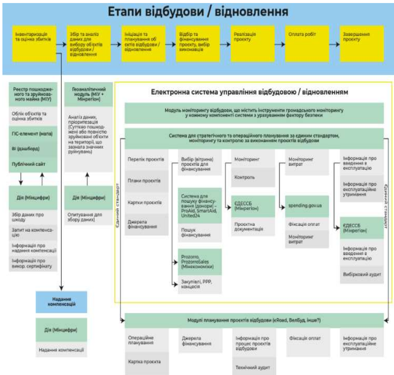
Рис. 2. Загальна схема електронної системи управління відбудовою