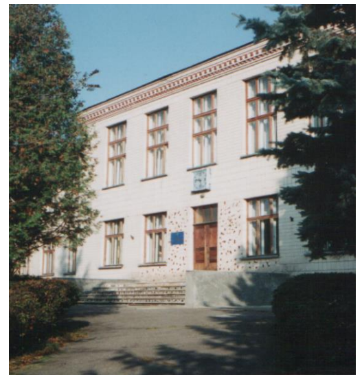
Рис. 1. Адміністративна будівля Інституту рибного господарства Національної академії аграрних наук України (за URL:

Інститут рибного господарства Національної академії аграрних наук України – головна наукова установа, що визначає та розробляє перспективні напрями розвитку рибного господарства,