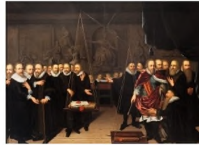
Алегорія на теологічний диспут між армініанами та їхніми супротивниками. Авраам ван дер Ейк, 1721