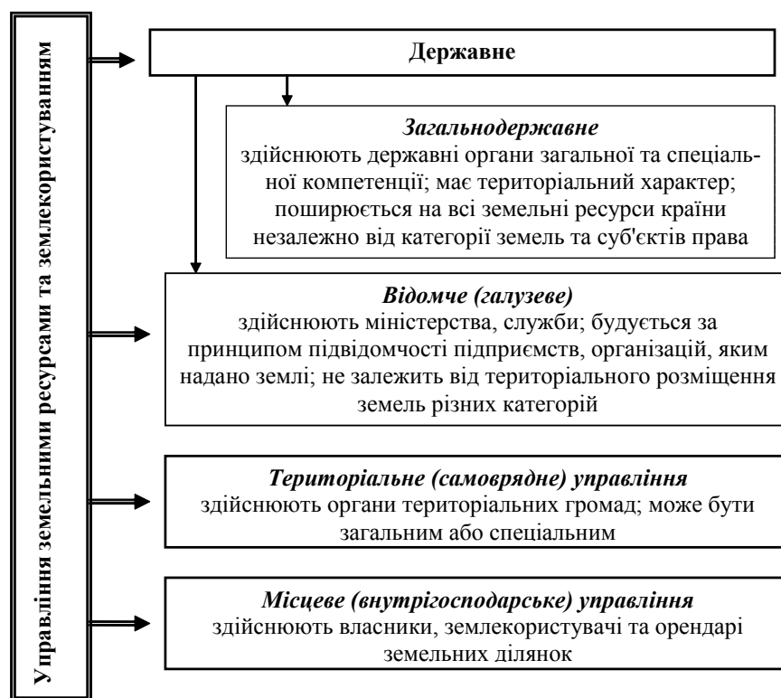
Рис. 1. Види управління земельними ресурсами та землекористуванням

Як свідчать дані таблиці 1, у світовій практиці термін територіальне планування землекористування майже в 4 рази більш затребуване (129 млн) ніж територіальне планування територій (34 млн). Водночас в Україні територіальне планування землекористування вживається більш як у 10 разів менше (0,5 млн), ніж територіальне планування територій (5,8 млн). Це обумовлює здійснення сучасних досліджень необхідної трансформації управління земельними ресурсами та землекористуванням.