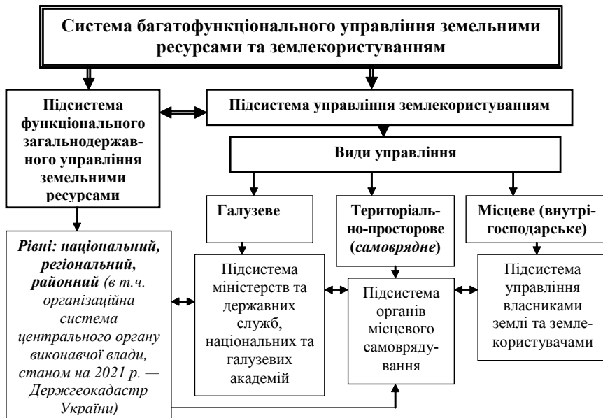
Рис. 2. Логічно-змістовна модель системи багатofункціонального управління земельними ресурсами та землекористуванням в Україні

цілому це призначення полягає в тому, щоб прогнозувати та забезпечувати вирішення суспільних проблем щодо організації екологічно раціонального землекористування, а по можливості запобігати їх виникненню, забезпечити вільний доступ громадян до земельних ресурсів, забезпечувати вироблення і реалізацію стратегії сталого (збалансованого) розвитку землекористування.