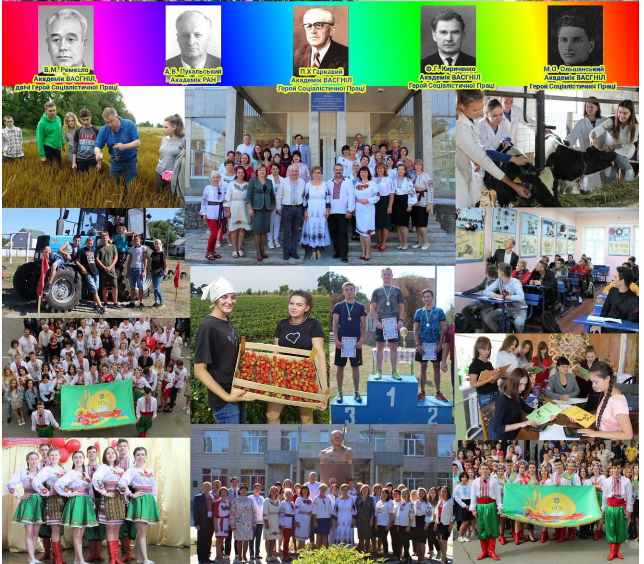
ВСП «Маслівський аграрний фаховий коледж ім. П.Х. Гаркавого Білоцерківського Національного аграрного університету» : вчора, сьогодні, завтра