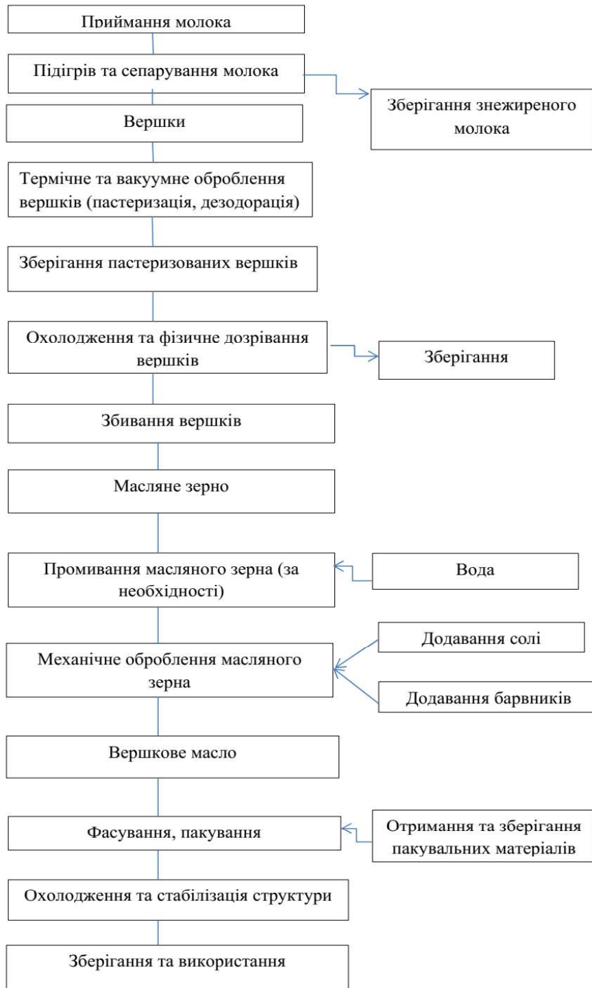
Рис. 1. Блок-схема виробництва масла вершкового.

До загальних підготовчих операцій виробництва масла належать: приймання та підготовка сировини, отримання вершків традиційної жирності, пастеризація і дезодорація вершків. Метод збивання вершків передбачає операції фізичного дозрівання; збивання вершків; промивання масляного зерна (за необхідності); соління (для солоного масла); додавання барвника (за необхідності); механічного