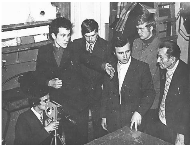
Фото 3. Студенти кіновідділення на заняттях.