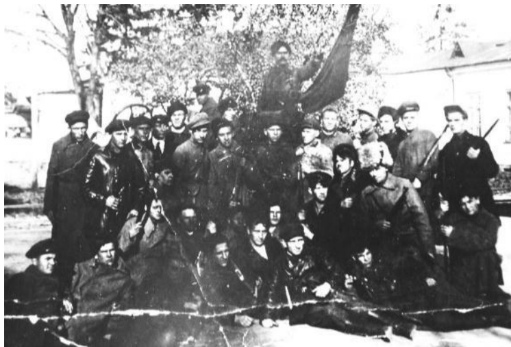
Фото 1. Стилізація до фільму «Чапаєв», 7.11.1937 рік.