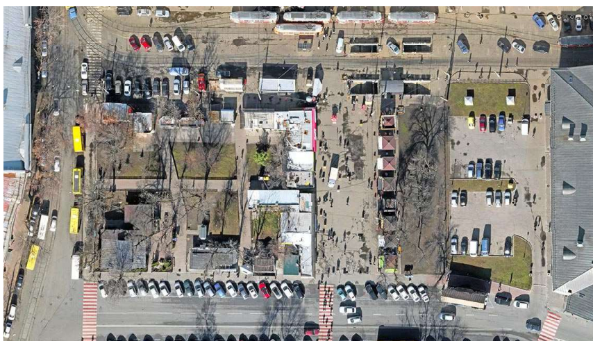
Рисунок 8. – Контрактная площадь. Сквер №3. 2016 г.

В 1976 г. Украинским научно-исследовательским и производственным управлением по заказу властей был разработан проект реконструкции площади на исторической основе. Главным архитектором была Валентина Шевченко. На протяжении многих лет по этому проекту были воссозданы Гостиный двор, фонтан «Самсон» с ротондой, церковь Успения Богородицы Пирогощи, колокольня Греческого монастыря, отреставрирован академический корпус Киево-Могилянской академии, Контрактный дом. В 1991 г. после обретения Украиной независимости проект перестали финансировать, невыполненными остались работы по восстановлению Магистрата, завершению ансамбля общественного центра Уильяма Гесте и благоустройству площади.