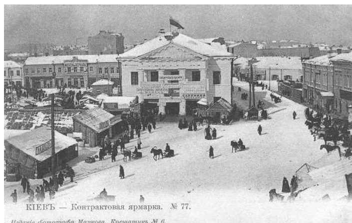
Рисунок 2. – Контрактная (Александровская) площадь 1913 год

Сейчас на площади растут 1618 экземпляров деревьев и кустарников, из них 496 деревьев. Среди них выделено 65 видов и 24 культивара, которые принадлежат к 41 роду и 23 семействам. Наиболее распространены одиннадцать видов деревьев, которые составляют почти 77% от общего количества. Большинство деревьев отнесены к I и II категории санитарного состояния, т.е. практически здоровы. К III категории отнесены ряд деревьев, заселенных Viscum album L., это виды Fraxinus lanceolata Borkh, Acer sacharinum March., Robinia pseudoacacia L., Populus balsamifera L [9].