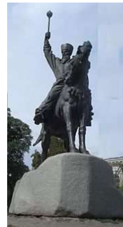
Рисунок 6. – Памятник гетьману П.К. Сагайдачному в Киеве

После провозглашения независимости Украины на площади отстраивается уничтоженная в 30 –х годах прошлого столетия церковь Успения Богородицы Пирогощи. В сквере перед Гостиным двором устанавливается величественный памятник гетману Петру Канашевичу-Сагайдачному (2001 г.).