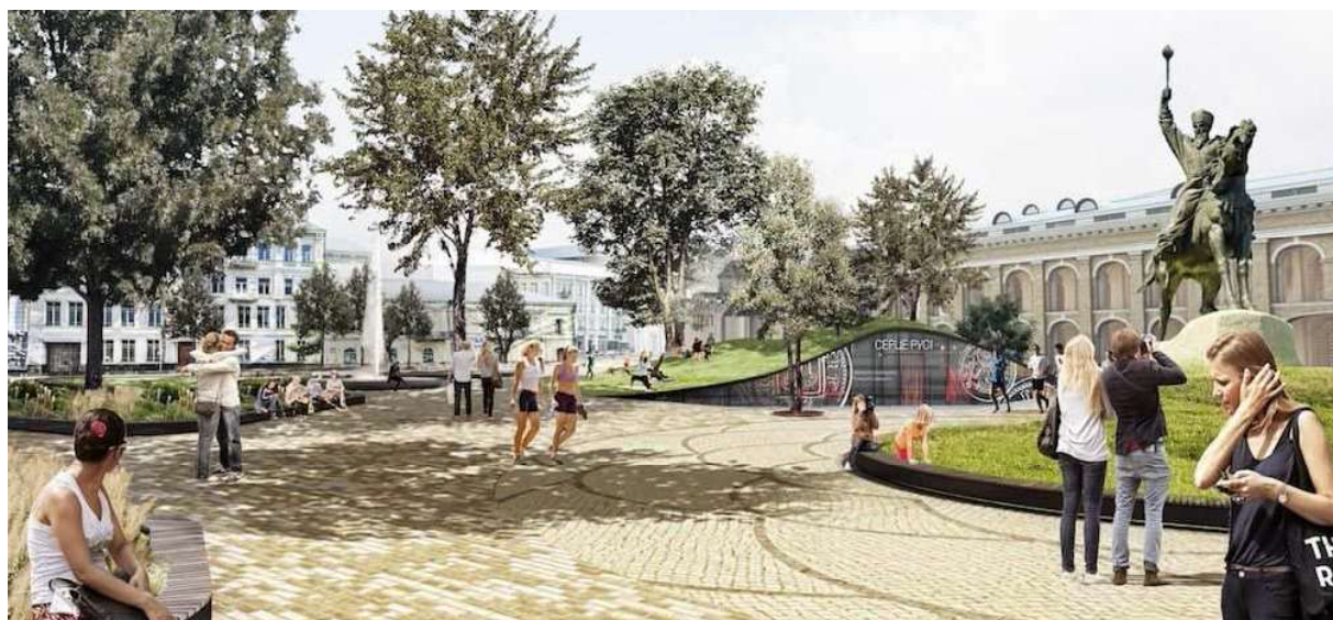
Рисунок 12. – Реконструкция Контрактовой площади. Авторский коллектив «Киевская гостиная»

Одной из наиболее сложных задач во время реконструкции насаждений парка, является создание напочвенного покрова под деревьями. Устойчивая тень под липами и кленами не позволяет использовать газонное покрытие – злаковые травы в условиях затенения гибнут. Для решения этой проблемы мы