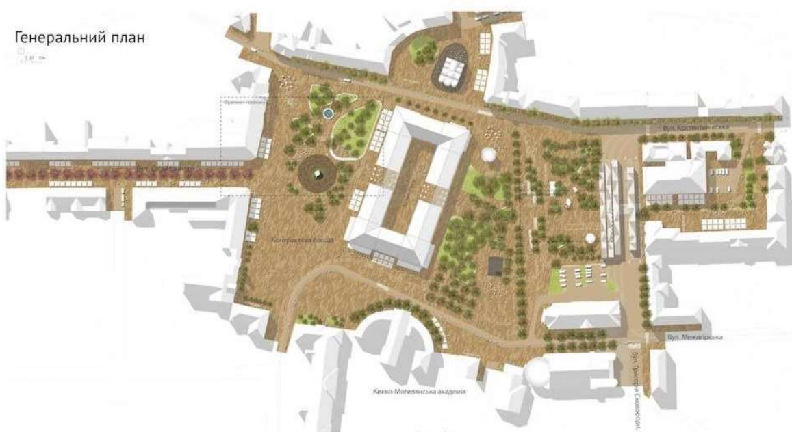
Рисунок 9. – Проект реконструкции Контрактовой площади. Авторский коллектив «Киевская гостиная».

В последнее десятилетие были неоднократные попытки приступить к реконструкции площади. Одним из вариантов было предложено реконструировать архитектурные сооружения Контрактовой, взяв за основу проект начала XIX в. архитектора Гесте. С 2011 по 2015 гг. проводятся многочисленные исследования «Стратегии урбанистического будущего Киева». В 2012 г. архитектурный фестиваль CANactions и Представительство Фонда им. Гайнриха Бюлля в Украине провели воркшоп «Контрактовая площадь: сценарии развития», в котором приняли участие 25 активных молодых людей с разных стран мира, в процессе которого представители разных профессий определили, как трансформировать площадь [17]. В 2015г. был проведен архитектурный конкурс, в котором приняли участие более десяти творческих коллективов. Победил проект авторского коллектива «Киевская гостиная». В июне 2017 г. был презентован проект капитального ремонта сквера №3 на Контрактовой, разработанный «Студией ландшафтной архитектуры Максима Коцюбы». Этот проект стал первым шагом к воплощению общей реконструкции проекта «Киевская гостиная», в котором предусмотрено [18]. Капитальный ремонт закончили к концу сентября.