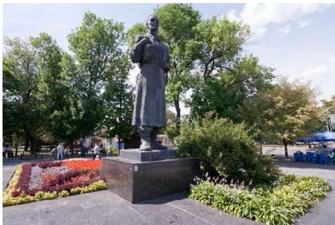
Рисунок 5. – Памятник Г.С. Сковороде на Контрактной площади

С развитием транспорта площадь становится важной транспортной развязкой, соединяющей метро, трамвай, троллейбусы и автобусы. В 1976 году сооружается памятник украинскому писателю и философу Григорию Сковороде.