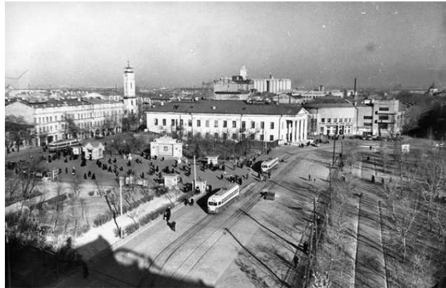
Рисунок 4. – Контрактная (Красная) площадь 1953 год

С развитием транспорта площадь становится важной транспортной развязкой, соединяющей метро, трамвай, троллейбусы и автобусы. В 1976 году сооружается памятник украинскому писателю и философу Григорию Сковороде.