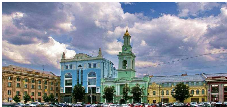
Рисунок 7. – Стоянка транспорта на Контрактной площади 2016 год

В начале 90-х годов сквер возле метро обрастает киосками и небольшими магазинчиками, что уродует внешний вид площади и только в 2017 году эти МАФы, наконец, сносятся. Кроме того, на площади находятся многочисленные хаотичные парковки автомобилей. Огромной проблемой становится транспортное сообщение на площади – её пропускная способность не рассчитана на возросший транспортный поток.