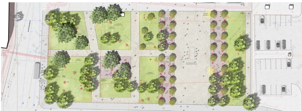
Рисунок 11. – Проект реконструкции сквера № III на Контрактной площади «Студия ландшафтной архитектуры Максима Коцюбы»