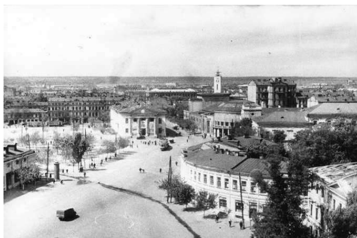
Рисунок 3. – Контрактная (Красная) площадь 1946 год