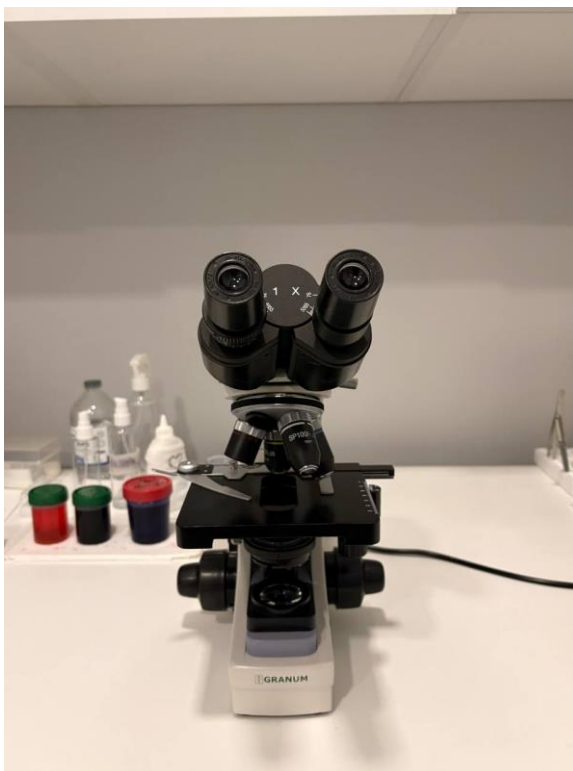
Рис. 2.7. Мікроскоп