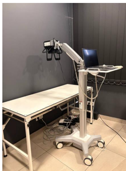
Рис. 2.3. Кабінет для рентгенологічного дослідження