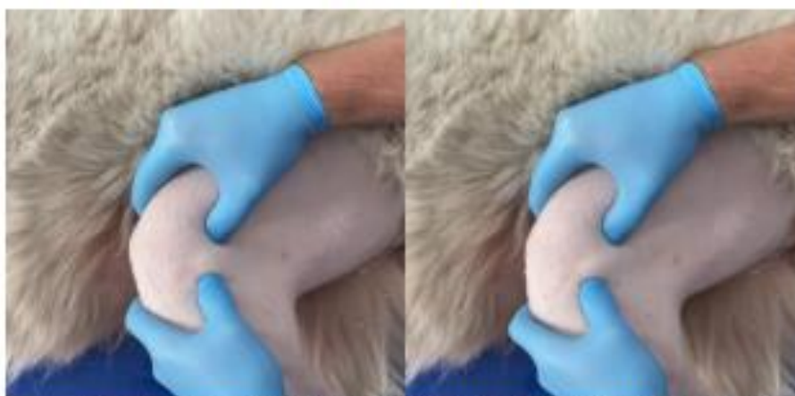
Рис. 1. Діагностичний симптом патологічної рухливості кісток гомілки відносно стегнової кістки у алабая.

Результати дослідження. За даними анамнезу в собак середніх та великих порід зазвичай відбувався розвиток гострої або поступово зростаючої кульгавості на тазову кінцівку. Через 2-4 дні з'являлася легка опора на хвору кінцівку, яка до 7-12 доби переходила у постійну кульгавість опірної кінцівки. Інколи вона посилювалася на початку руху та після навантажень. Часто через кілька хвилин після початку руху кульгавість зменшувалася. У випадках з поступовим розривом зв'язки спочатку кульгавість зустрічалася періодично, а протягом декількох тижнів переходила у постійну. Один із діагностичних тестів цієї патології – симптом «висувної шухляди» – патологічної рухливості кісток гомілки відносно стегнової кістки (Рис. 1).