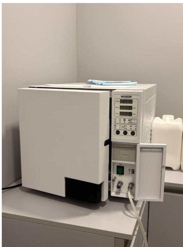
Рис. 2.6. Автоклав