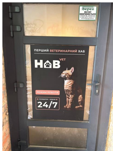
Рис. 2.1. Клініка НАВ vet

Ветеринарна клініка НАВ vet (Рис. 2.1) сучасний багатопрофільний ветеринарний заклад, розташований в центральній частині міста Києва за адресою: вул. Велика Житомирська, 30. Клініка працює цілодобово, без вихідних, що дозволяє надавати невідкладну ветеринарну допомогу тваринам у будь-який час доби. Основною особливістю НАВ vet є поєднання сучасного технічного оснащення, широкого спектра ветеринарних послуг та індивідуального підходу до кожного пацієнта. Заклад був створений власниками домашніх тварин, які прагнули організувати комфортний простір для лікування та догляду за улюбленцями. Головною ідеологією клініки було і залишається до сьогодні мінімізація стресу у тварин під час відвідування ветеринарного лікаря та створення максимально комфортних умов для власників і пацієнтів.