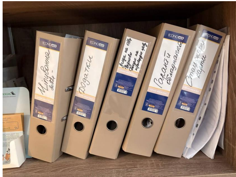
Рис. 2.9. Журнали

Перелік журналів, які знаходяться в клініці (Рис. 2.9): журнал чіпування тварин, додатки, стаціонарні карти, гарантії на обладнання, стаціонарні карти, згоди на оперативні втручання.