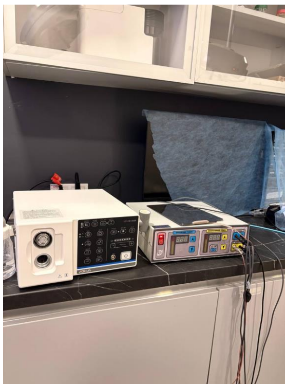
Рис. 2.8. Коагулятор