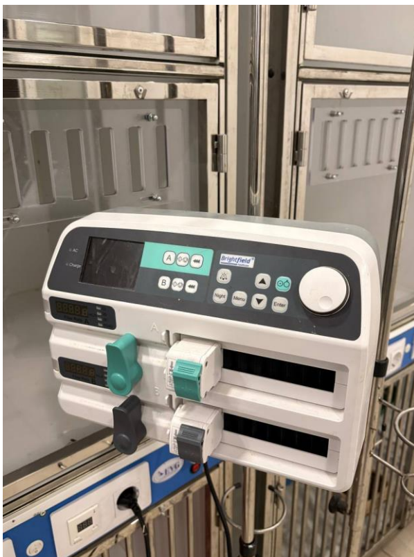
Рис. 2.5. Шприцеві насоси