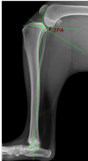
Рис. 1.1. Рентгенограма для вимірювання ТРА за Слокумом та Девайном [25].

Магнітно-резонансна томографія (МРТ) найбільш інформативний метод для оцінки м'яких тканин колінного суглоба. Вона дозволяє безпосередньо візуалізувати розрив ПХЗ, оцінити стан менісків, виявити супутні ураження хряща та зв'язок, а також визначити ступінь запалення та набряку тканин.