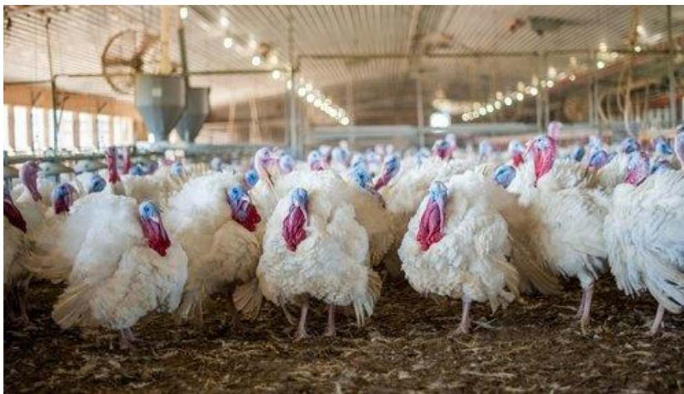
Рис.1 Доросла птиця кросу Hybrid Converter Novo

Добових індичат-бройлерів кросу Hybrid Converter Novo (Франція) птахопідприємство завозить їх з Польщі, з дочірніх підприємств компанії «Хайбрид Туркейс»