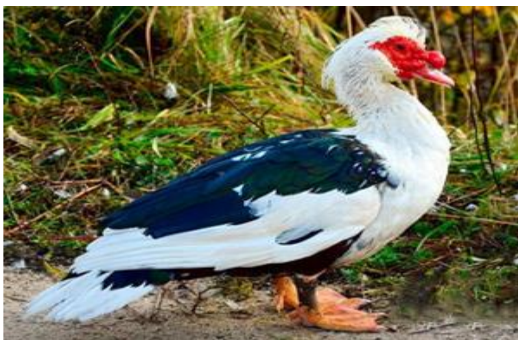
Рис.1 Самець мускусної качки

Підприємство отримує добовий молодняк мускусних качок на власному інкубаторію фірми Pas Reform. Інкубаційні яйця отримує від власного батьківського стада угорської селекції