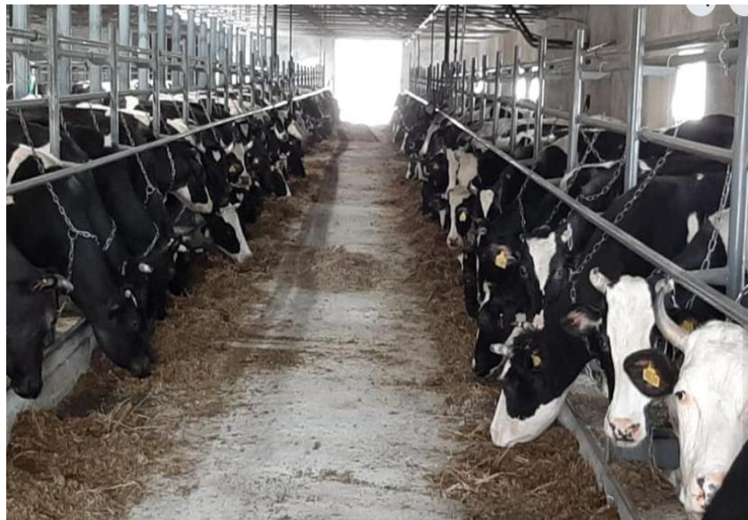
Рис. 3.4. Годівля корів із кормового столу

У господарстві годівлю корів організують із кормового столу (рис.3.4), що забезпечує тваринам постійний доступ до повнораціонних збалансованих кормосумішей. Такий спосіб годівлі сприяє рівномірному споживанню корму протягом доби, підтриманню високої продуктивності та покращенню фізіологічного стану тварин. Роздавання кормів здійснюють регулярно відповідно до технологічних норм утримання та продуктивності корів.