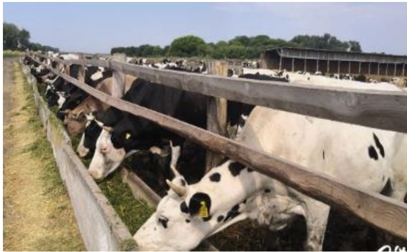
Рис. 3.5. Годівля корів зеленими кормами на вигульно-кормових майданчиках

На виробництво молока належним чином впливає механізація процесів доїння, годівлі і водонапування. У ДП ДГ "Нова Перемога" доїння корів здійснюється за допомогою молокопроводу, що дозволяє ефективно та зручно збирати молоко. Молоко по молокопроводу транспортується через систему фільтрів у танк-охолоджувач, де й зберігається. Для охолодження молока в господарстві використовують холодильне обладнання фірми Delaval.