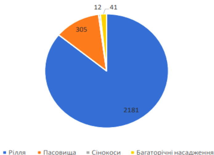
Рис. 3.1. Структуру земель сільськогосподарського призначення, га

Важливою характеристикою діяльності ДПДГ «Нова Перемога» є склад і структура земельних угідь і посівних площ. Загальна земельна площа господарства за останні три роки не змінювалась і становить 3145 га. Структуру земель сільськогосподарського призначення подано на рисунку 3.1.