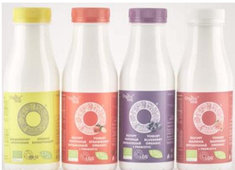
Рис.3.7. Йогурти органічні з різними наповнювачами ТМ «OrganicMilk»

Йогурт органічний – кисломолочний продукт, що виробляється шляхом сквашування молока органічного спеціальними заквасками Lactobacillus delbrueckii subsp. bulgaricus , Streptococcus salivarius subsp. Thermophilus для подальшого вживання його в їжу.