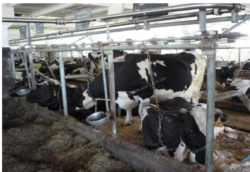
Рис. 3.3. Технологія утримання корів в господарстві

В умовах ДП ДГ «Нова Перемога» худобу утримують в реконструйованих наявних приміщеннях, застосовують прив'язний спосіб утримання дійних корів з вигулом на кормових майданчиках, що забезпечує індивідуальний догляд, нормовану годівлю, роздоювання, контроль запуску, отелення та відтворну здатність тварин, раціональне використання кормів та менші витрати підстилки (рис. 3.3). Худоба на сухості, телята та молодняк утримуються безпривязно.