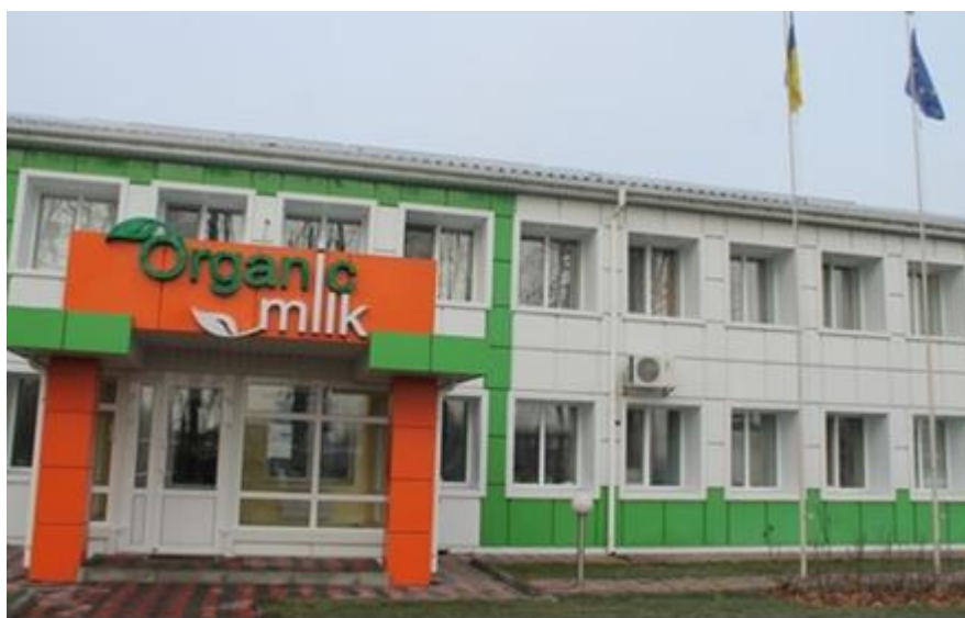
Рис.3.6. ТОВ «Органік Мілк»

Підприємство здійснює свою діяльність з 2013 року в місті Баранівка Житомирської області.