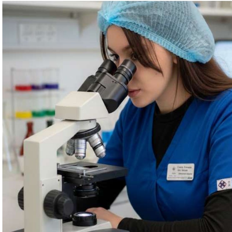
Рис. 2.3 – Мікроскопія пошкоджень шкіри для диференційної діагностики БАД

Проводили диференційну діагностику за допомогою люмінесцентного тесту із використанням лампи Вуда, скотч-тесту на наявність грибкового ураження та поверхневі й глибокі зіскрібки уражень шкіри, мікроскопія ексудату пошкоджень на наявність підшкірних кліщів Demodex , Sarcoptes , Notoedres (рис. 2.3.).