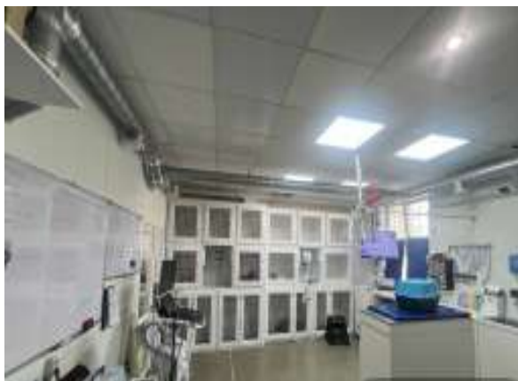
Рис. 2.12 — Стаціонар для собак