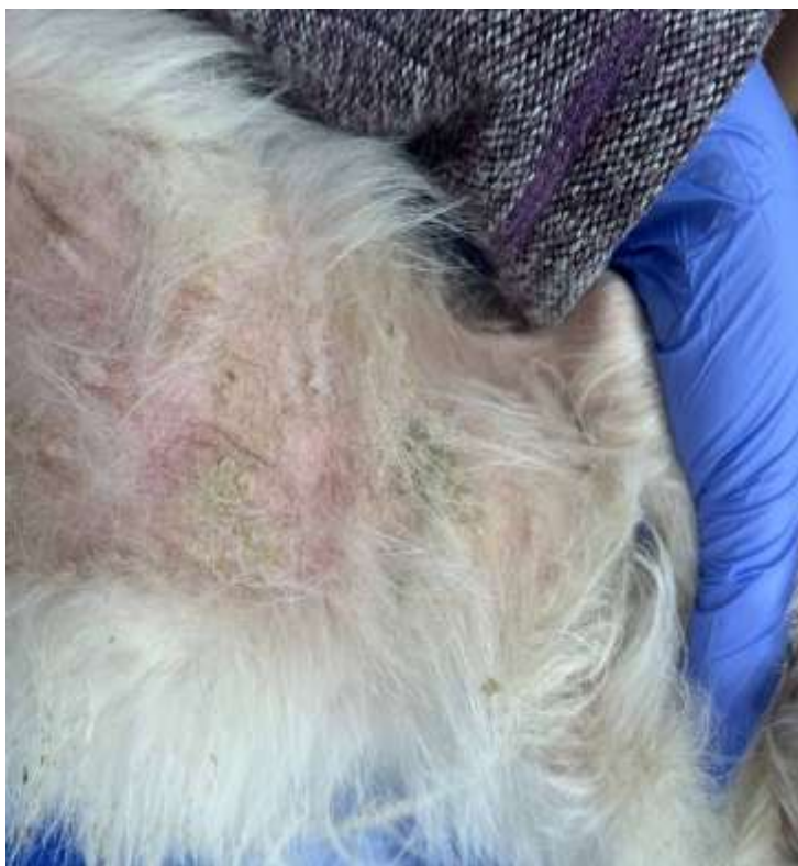
Рис. 2.1 – Візуальний огляд тварин на наявність особин бліх

Цитологічне дослідження проводили мікроскопічним оглядом уражень шкіри для диференціації та точності поставлення діагнозу на БАД та, викликаний свербіж.