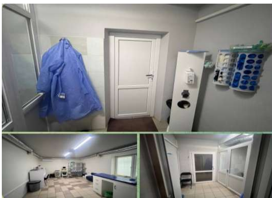
Рис. 2.14 — Вірусний стаціонар

На першому поверсі розміщений ізоляційний стаціонар для тварин із невідомим вакцинним статусом (переважно пацієнтів, доставлених волонтерами), що дозволяє мінімізувати ризики інфекційного зараження інших пацієнтів клініки. Окремо функціонує вірусний стаціонар із чітко організованою зоною для переодягання персоналу в захисний одяг перед входом до відділення (Рис. 2.14). Вірусний стаціонар оснащений індивідуальними боксами з підігрівом, оглядовим столом та повним набором витратних матеріалів для догляду та лікування інфекційних пацієнтів.