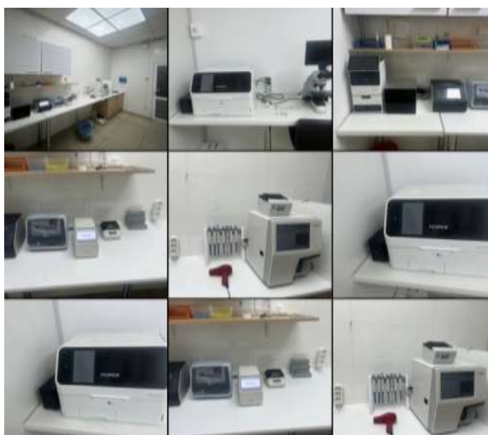
Рис. 2.9 — Лабораторія

Лабораторія оснащена аналізаторами для багатьох видів досліджень, мікроскопом, холодильником де зберігаються вакцини, реагенти, препарати. (Рис.2.9).