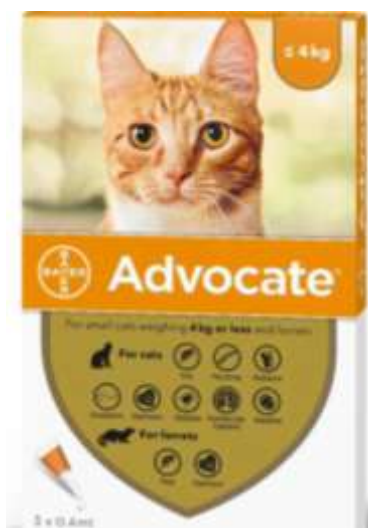
Рис. 4.1 - Препарат Advocate for Cats

У першій дослідній групі застосовували препарат Advocate for Cats (Рис. 4.1), який застосовували у формі крапель на холку відповідно до маси тіла тварини. До його складу входять імідаклоприд та моксидектин. Імідаклоприд забезпечує швидке знищення дорослих бліх завдяки впливу на нікотинові ацетилхолінові рецептори комах. Моксидектин після трансдермального всмоктування чинить системну дію та активний проти нематод і личинкових стадій паразитів. Препарат характеризується комбінованою контактною та системною дією і застосовується один раз на місяць.