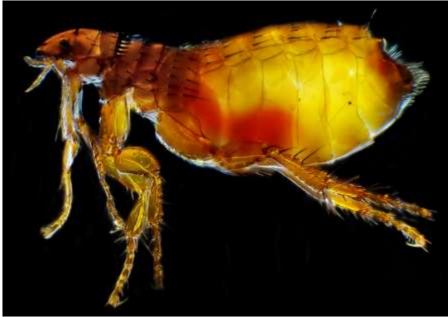
Рис. 1.1 – Ctenocephalides felis

Найвищий рівень ураження котів спостерігається у теплий період року (з травня по вересень), хоча при наявності опалення або теплої підлоги блохи можуть розмножуватись і взимку [12, 19]. Факторами, що сприяють поширенню дерматиту, є висока щільність тварин, відсутність регулярної профілактичної обробки, наявність безпритульних тварин у дворі, а також теплі, вологі кліматичні умови [20, 30].