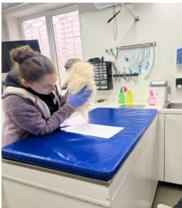
Рис. 2.2 – Виявлення фекалій бліх за допомогою вологого аркуша білого паперу