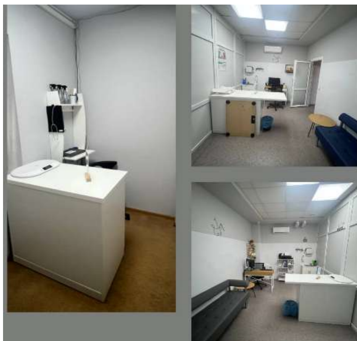
Рис. 2.8 — Оглядова для прийому пацієнтів

Оглядові оснащені всім необхідним для проведення огляду та маніпуляцій (Рис. 2.8)