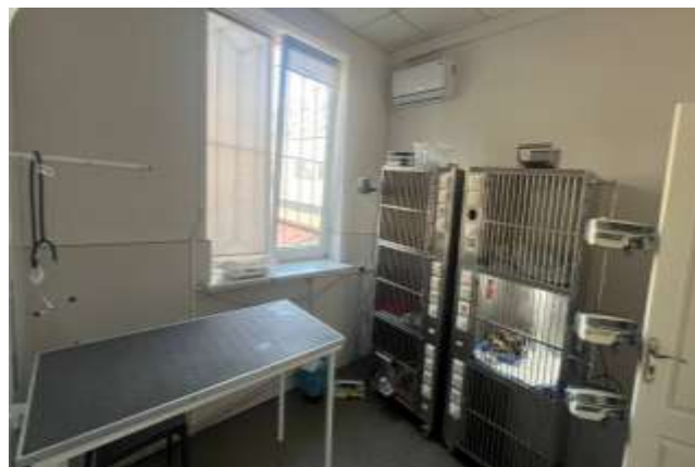
Рис. 2.13 — Стаціонар для котів

На першому поверсі розміщений ізоляційний стаціонар для тварин із невідомим вакцинним статусом (переважно пацієнтів, доставлених волонтерами), що дозволяє мінімізувати ризики інфекційного зараження інших пацієнтів клініки. Окремо функціонує вірусний стаціонар із чітко організованою зоною для переодягання персоналу в захисний одяг перед входом до відділення (Рис. 2.14). Вірусний стаціонар оснащений індивідуальними боксами з підігрівом, оглядовим столом та повним набором витратних матеріалів для догляду та лікування інфекційних пацієнтів.