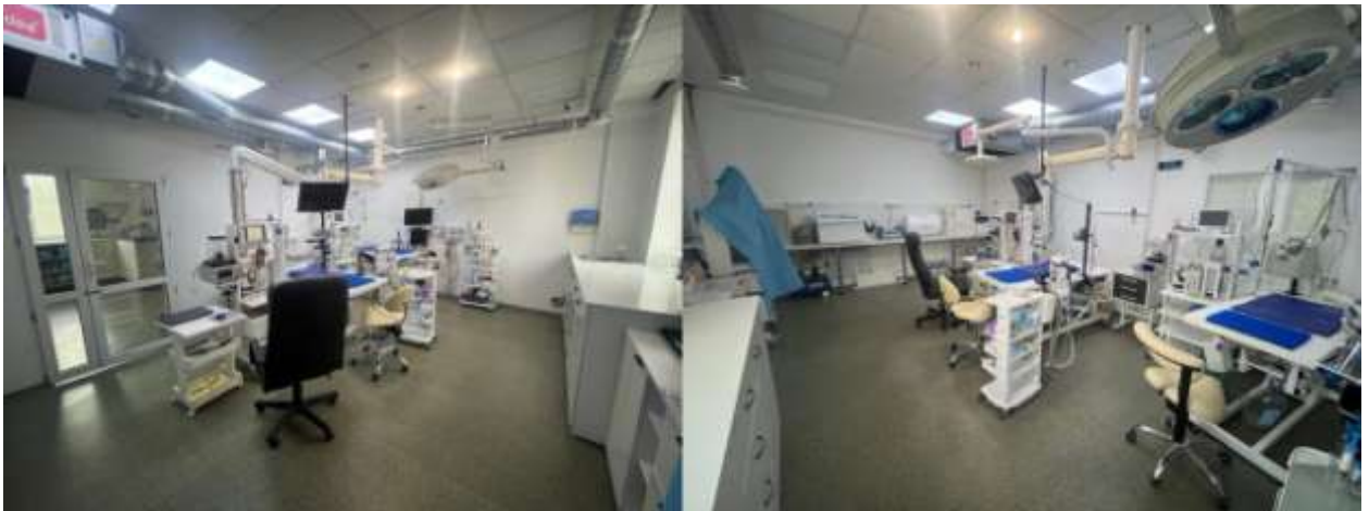
Рис. 2.11 — Стоматологічний кабінет

Кабінет Ультразвукової діагностики оснащений новим апаратом УЗД, столом на якому проводиться дослідження, є спеціальні подушки щоб тварину комфортно викласти для проведення дослідження, є спеціальний підігрів для гелю узд, окремий стіл для огляду та маніпуляцій.