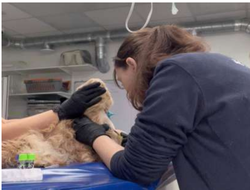
Рис. 2.4 – Відбір зразків крові для гематологічних досліджень

Приготовлені на знежирених предметних скельцях мазки залишали сохнути на повітрі. Розчини зливали в посуд. Мазок фіксували зануренням 5 разів на 1 секунду в реактив 1. Ідентичні дії проводили із реактивами 2 та 3. Мазок обробляли промиваючим розчином і залишали сушитися на повітрі.