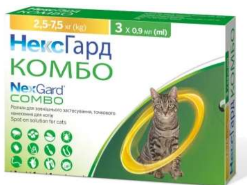
Рис. 4.2 - Препарат NexGard Combo

празіквантел. Афоксоланер належить до ізоксазолінів і має системну інсектицидно-акарицидну дію щодо бліх і кліщів. Еприномектин чинить антигельмінтний ефект проти нематод, а празіквантел — проти цестод. Препарат застосовували одноразово з інтервалом 30 діб, що забезпечувало комплексний контроль як ектопаразитів, так і ендопаразитів.