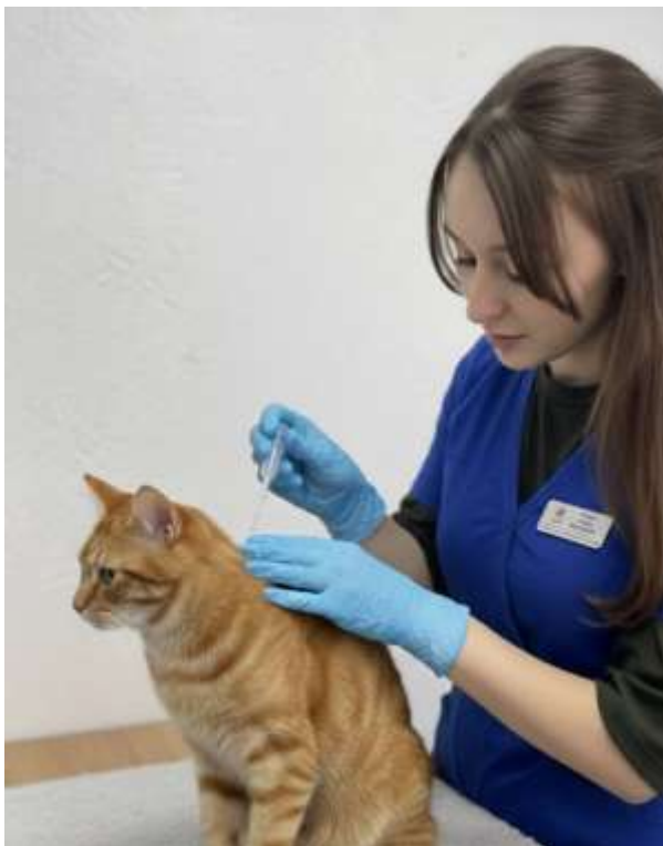
Рис. 2.6 – Обробка тварин протипаразитарними препаратами

( Stenocephalides spp. ) на тваринах до і після обробки протипаразитарними препаратами (рис. 2.6.).