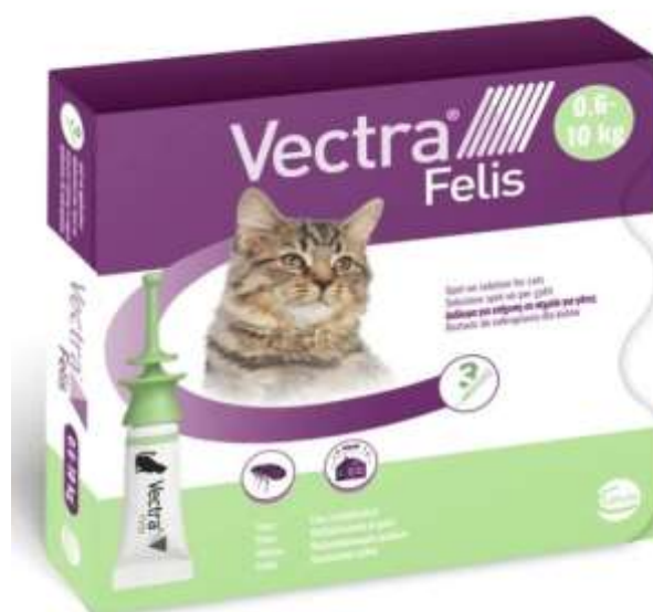
Рис. 4.3 - Препарат Vectra Felis

У третій дослідній групі застосовували місцево препарат VECTRA FELIS (Рис. 4.3), який містить динотефуран та пірипроксифен. Динотефуран має швидку контактну інсектицидну дію щодо дорослих бліх, викликаючи їх загибель протягом короткого часу після контакту з обробленою шерстю.