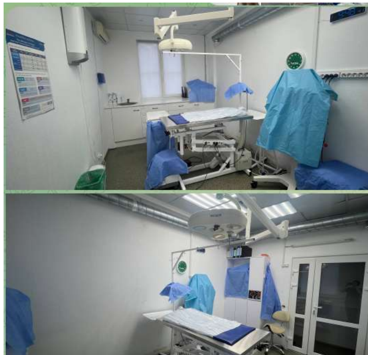
Рис. 2.10 — Операційна зала

Стоматологічний кабінет (Рис. 2.11) оснащений двома спеціалізованими стоматологічними столами з вбудованими умивальниками та системою відведення рідини, установками для професійної гігієни ротової порожнини, моніторингом пацієнта біля кожного робочого місця для