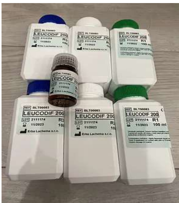
Рис.2.5 – Набір реагентів Лейкодіф 200

Приготовлені на знежирених предметних скельцях мазки залишали сохнути на повітрі. Розчини зливали в посуд. Мазок фіксували зануренням 5 разів на 1 секунду в реактив 1. Ідентичні дії проводили із реактивами 2 та 3. Мазок обробляли промиваючим розчином і залишали сушитися на повітрі.