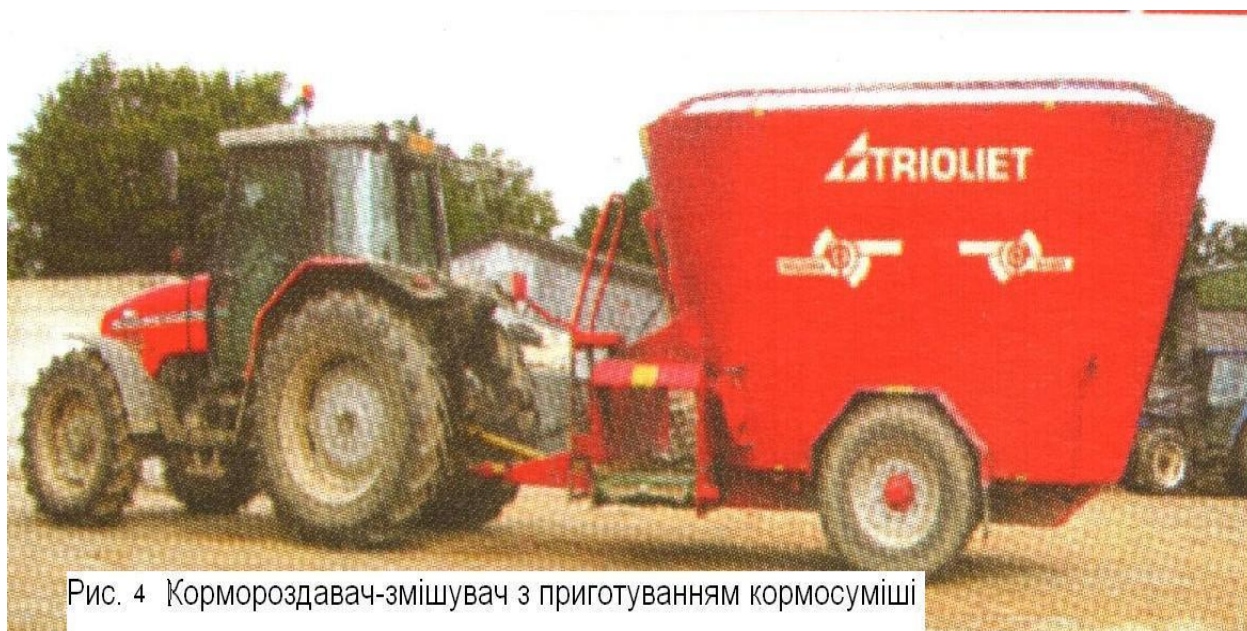
Рис. 4 Кормороздавач-змішувач з приготуванням кормосуміші