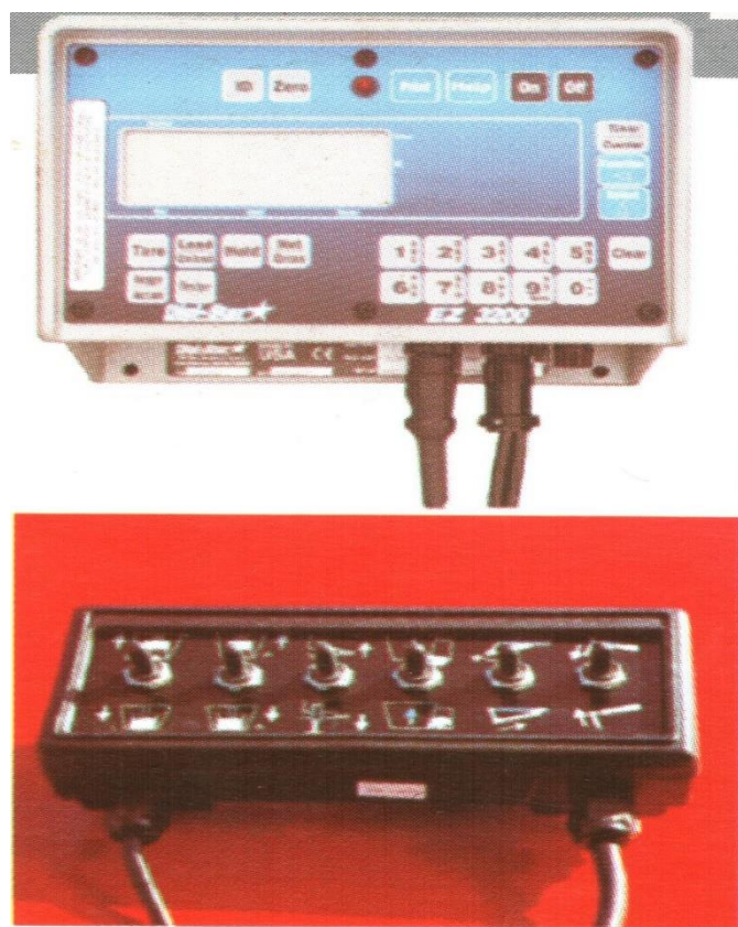
Рис. 3 . Пульт управління тензорними вагами на шасі кормороздавача

кормосуміші тварини поїдають майже у 2 рази швидше.