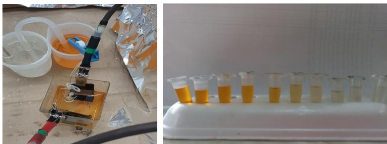
Рис. 4, 5. Зовнішній вигляд робочої комірки, знебарвлення розчину МО.