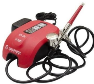
Рис.3. Зовнішній вигляд Аерографа DT – 5001.