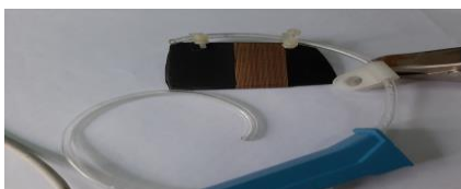
Рис.2. Зовнішній вигляд робочої скловуглецевої пластини.

Для одержання композитного матеріалу (склад електроліту становить 0,1М HF, 0,7М \text{MnSO}_4 , 1,5М (\text{NH}_4)_2\text{SO}_4 , \text{TiO}_2 (Evonik)) використовували метод електроосадження. Електроосаджений композитний матеріал наносили на скло вуглецеву пластину (Рисунок 2) з напленням за рахунок аерографа (Рисунок 3), скловуглецевий допоміжний електрод, з розчином МО 9,0 \cdot 10^{-5} М. В роботі використовували два режими темних умовах та в умовах УФ-опромінення. Дослід проводили до зміна забарвлення від концентрації МО 9,0 \cdot 10^{-5} М до обезбарвлення (Рисунок 4, 5).