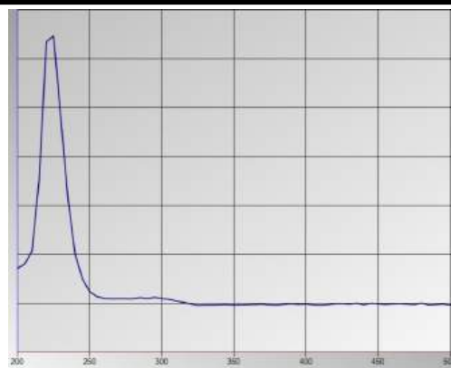
Figure 2. UV-spectrum of Tartaric acid 10^{-4}M

As a result of the conducted studies, it was shown that for salicylic acid, the absorption maximum is observed at 300 nm, and for tartaric acid – at 225 nm, which makes it possible to identify them when present together. The obtained results will be the basis for further development of the method for identification and quantitative determination of the above-mentioned acids in medicinal cosmetic products.