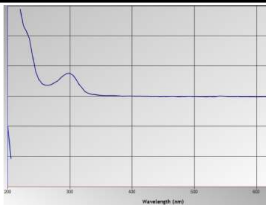
Figure 1. UV-spectrum of Salicylic acid 10^{-4}M