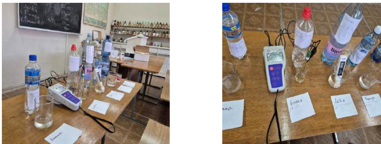
Рисунок 2. Проведення лабораторних досліджень.

Таким чином, основною метою роботи є встановлення показників рН та мінералізації деяких зразків питної води таблиця 1. Проби відбиралися зі звичайного магістрального водопроводу заправних станцій країн Євросоюзу, а саме: Фінляндії, Естонії, Латвії, Литви, Польщі. Окрім того, проаналізовано проби води України та, для порівняння, дистилляту Рис.2.