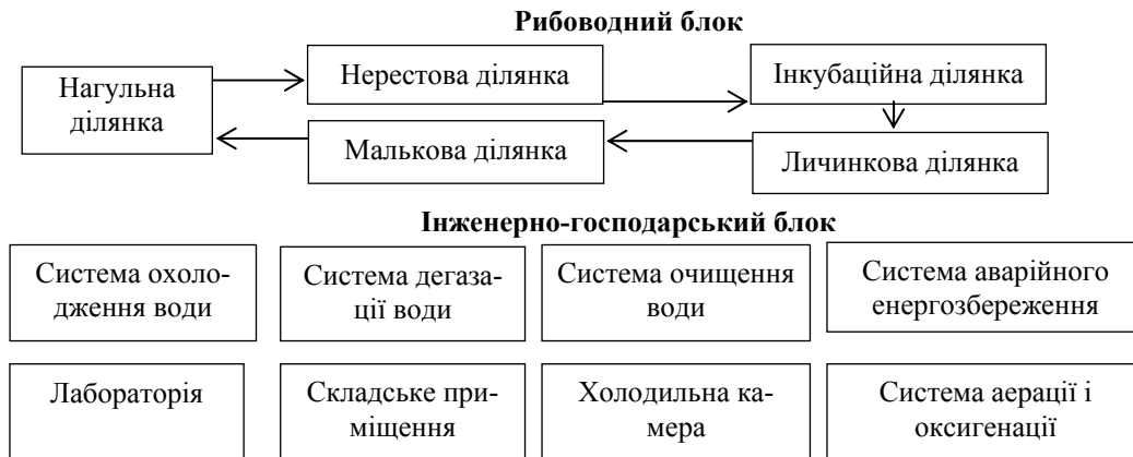
Рис. 1. Принципова схема повносистемного форелевого господарства

Зазвичай повний цикл вирощування форелі у господарстві включає технологічні етапи вирощування та реалізації харчової і рибоводної продукції. Важливими ланками технологічного процесу є використання кормів і застосування лікувально-профілактичних та дезінфекційних препаратів (рис. 2).