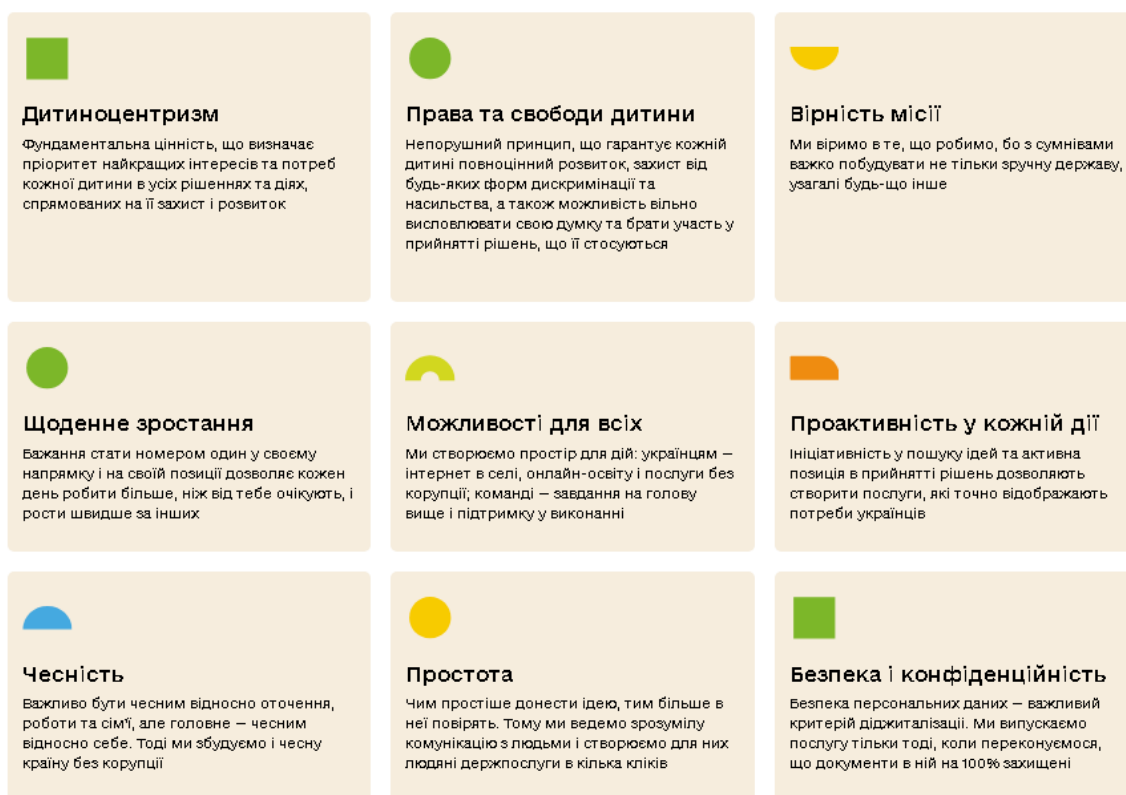
Рис. 2.1. Принципи роботи Державної служби України в справах дітей

Місія Державної служби України в справах дітей - захищати права дітей, забезпечувати їхнє благополуччя та всебічний розвиток, сприяти соціальній інтеграції дітей-сиріт та дітей, позбавлених батьківського піклування, а також підтримувати родини в кризових ситуаціях, щоб кожна дитина мала можливість жити у турботливій сім'ї, а основними принципами є дитиноцентризм, де кожна дитина має виховуватися в родині (рис. 2.1) [26].