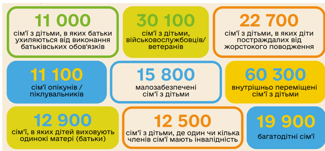
Рис. 2.6. Кількість сімей з дітьми вразливих категорій, 2024 р. [49]

Найбільша кількість сімей з дітьми вразливих категорій охоплено соціальними послугами в Одеській, Харківській, Чернігівській областях та м. Києві, що подано на рис. 2.6.