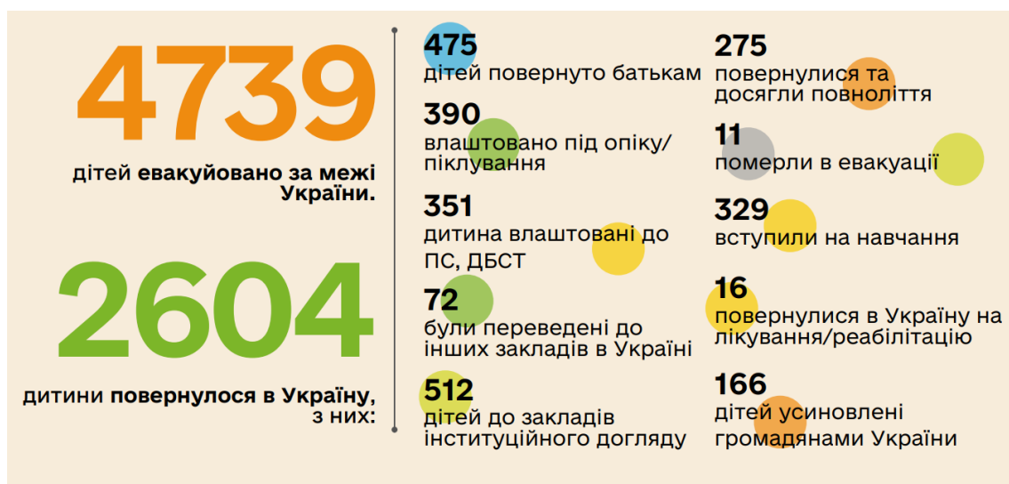
Рис. 2.5. Дані про переміщення дітей під час війни з 2022 р. [49]

Під час повномасштабного вторгнення рф за межі нашої держави було евакуйовано 4739 дітей, які перебували під контролем Державної служби України у справах дітей. Дані про переміщення дітей подано на рис. 2.5.