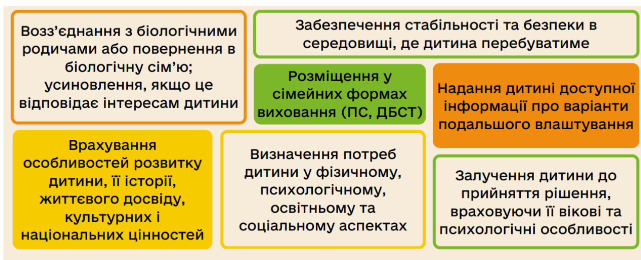
Рис. 2.4. Основні завдання забезпечення її найкращих інтересів дітей [49]

кожної дитини з метою забезпечення її найкращих інтересів у конкретному випадку. Основними завданнями цього процесу подано на рис. 2.4.