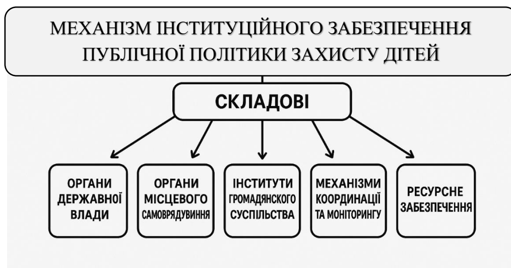
Рис. 1.1. Складові механізму інституційного забезпечення публічної політики захисту дітей

В умовах війни інституційна система повинна бути гнучкою, адаптивною й оперативною, оскільки швидкість прийняття рішень безпосередньо впливає на життя дітей [2].