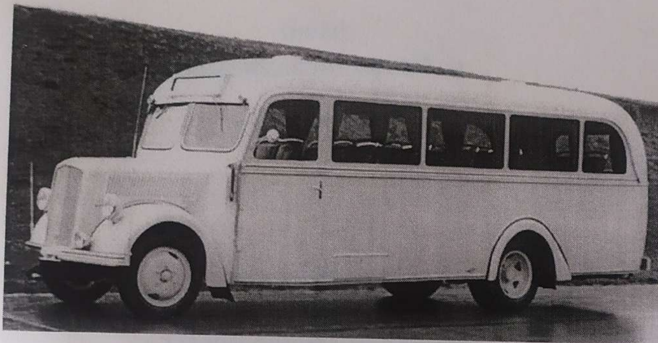
Фото 2. Трофейний автобус «Opel-Blitz» модель KFZ 305/120, 1935 р.

Автобус «Opel-Blitz» був єдиною трофейною технікою, яка була у власності інституту, тому не дивно, що він запам'ятовується та став легендою.