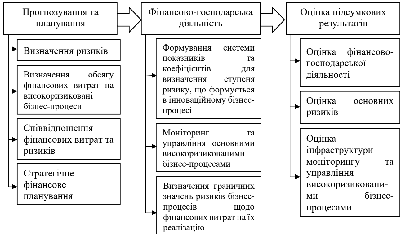
Рис. 2. Методика оцінки високоризикованих бізнес-процесів підвищення фінансової стійкості підприємства

Аналізуючи фактори, що впливають на фінансову стійкість підприємства, варто виділити наступні: динамічність операційного середовища, швидкість впровадження інноваційних проектів і продуктів, можливість залучення великих інвестицій, здатність освоєння нових ринків, а також проведення як зовнішньої, так і внутрішньої реструктуризації.