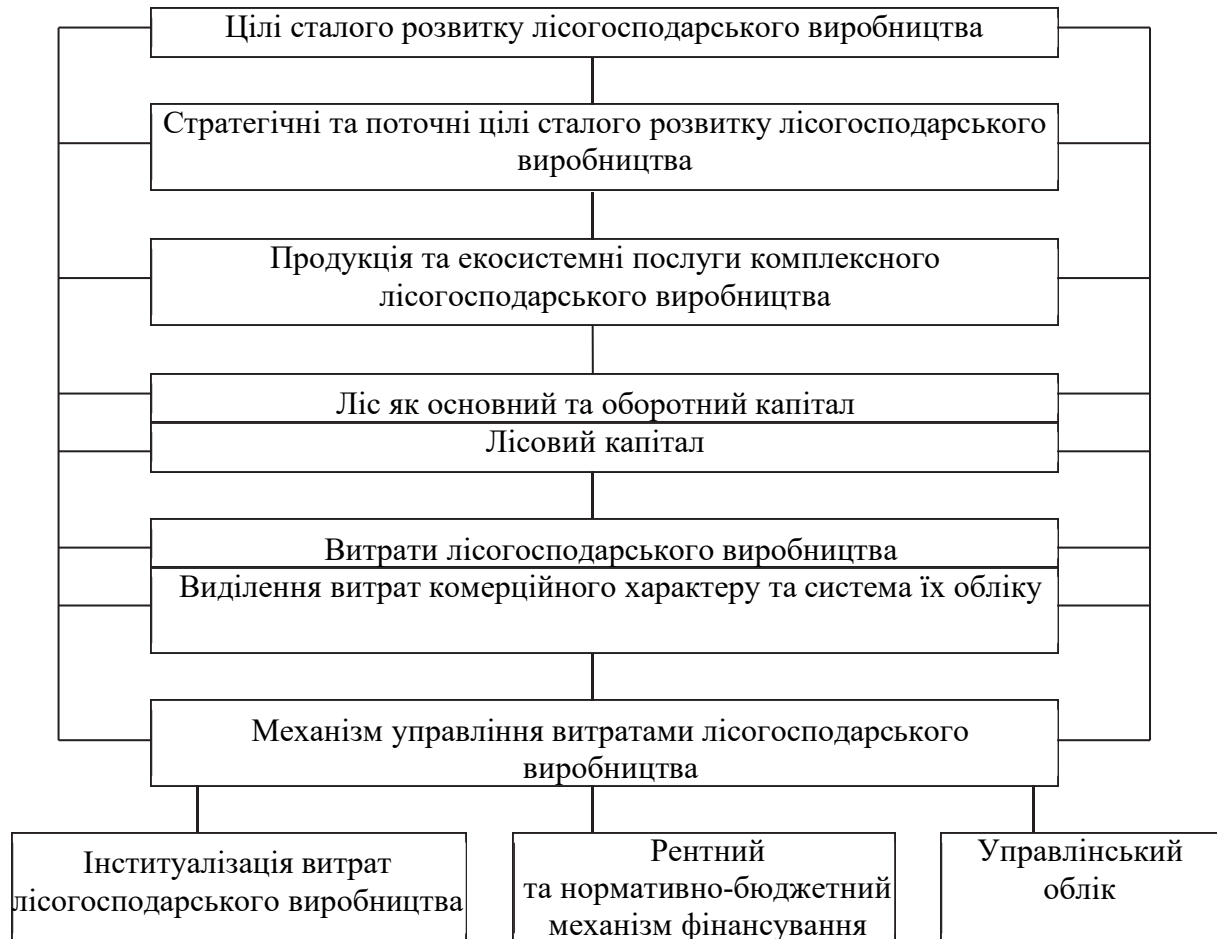
Рис. 1. Концептуальна схема побудови оцінки економічної ефективності ведення лісгосподарського виробництва в умовах сталого розвитку

досягненню цілей сталого розвитку. Концептуальну схему побудови оцінки економічної ефективності ведення лісгосподарського виробництва наведено на рис. 1.