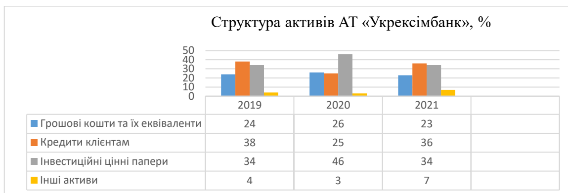
Рис. 2. Динаміка структури активів АТ «Укрексімбанк» за 2019-2021 рр., %

Джерело: побудовано автором на основі даних фінансової звітності АТ «Укрексімбанк».