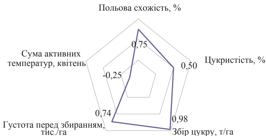
Рисунок 2. Кореляційні зв'язки між урожайністю коренеплодів та чинниками, що її обумовлюють (середнє за 2010–2014 рр.)

Результати дослідження взаємозв'язків, що впливають на врожайність буряків цукрових можна подати у вигляді кореляційних плеяд. Кожна точка плеяди відображає силу конкретного кореляційного зв'язку між урожайністю та іншими чинниками, що на неї впливають. На рисунку 2 наведено лише достовірні кореляційні зв'язки.