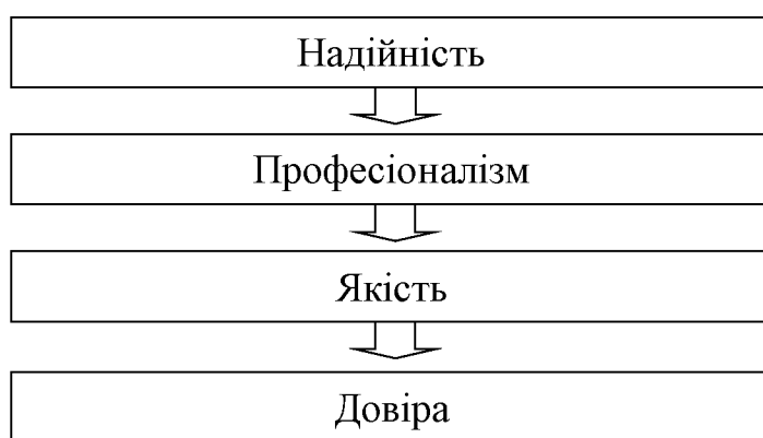
Рис. 2. Фактори досягнення успіху у професії бухгалтера.

Згідно з Кодексом етики, цілі бухгалтерської професії полягають у виконанні своєї роботи відповідно до встановлених стандартів які задовольняють інтереси громадськості [3]. Щоб досягти вказаних цілей, необхідно володіти чотирма основними факторами, які є взаємопов'язані між собою (рис. 2).