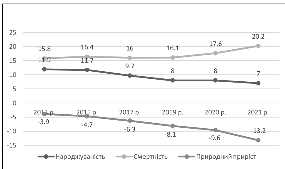
Рис. 1. Загальні коефіцієнти природного руху населення в Київській області, на 1000 осіб наявного населення

В Київській області рівень народжуваності нижчий, а рівень смертності вищий, ніж в середньому по Україні (рис.1).