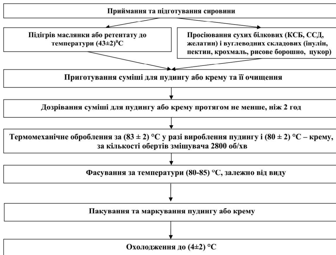
Рис. 2. Технологічна схема виробництва структурованих молочних десертів з комбінованим складом сировини.