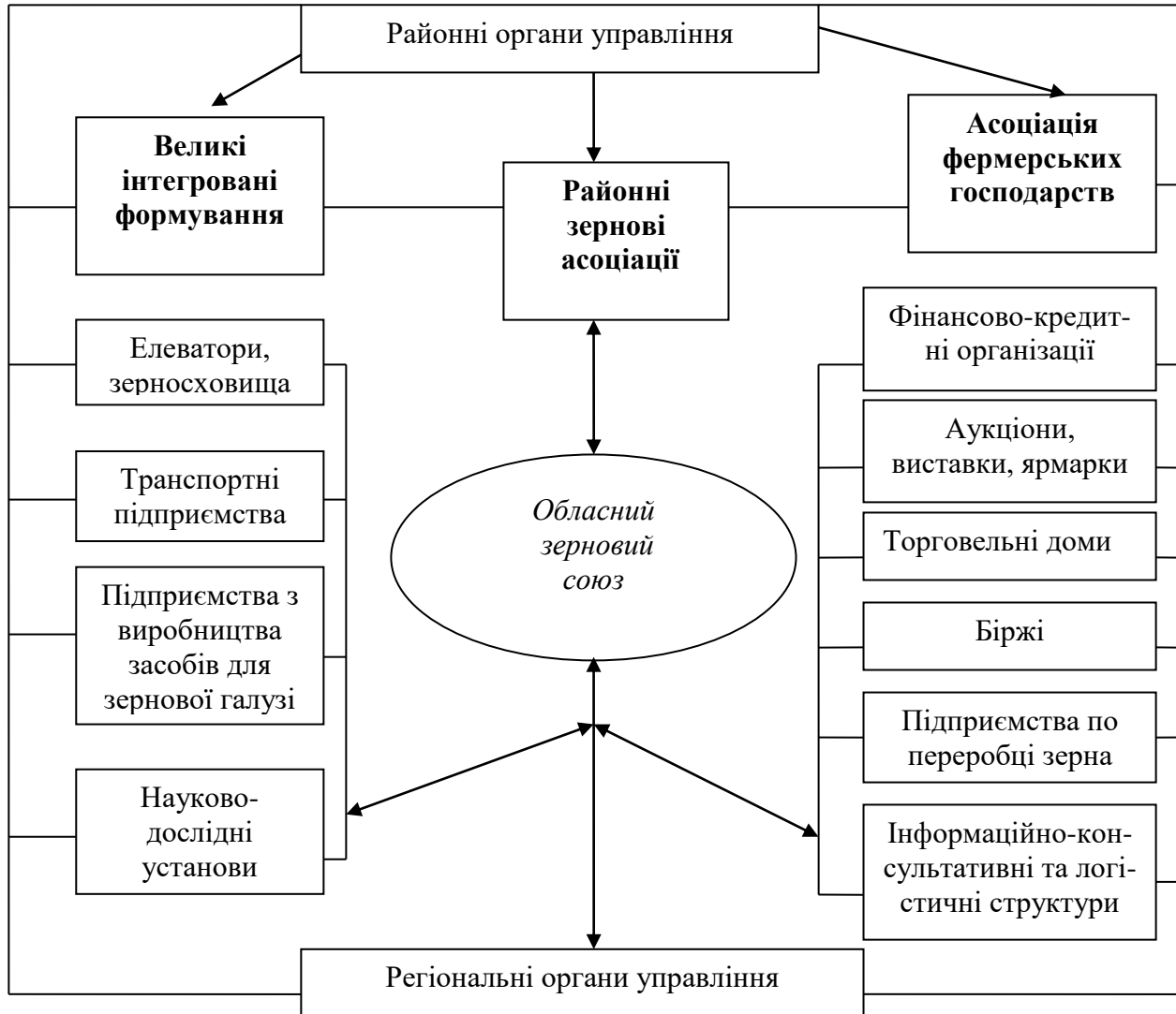
Рис. 3. Структура зернового союзу на регіональному рівні

та сприятимуть їх виходу на зовнішній ринок. На рисунку 3 подано схему організації зернового союзу на рівні Київського регіону.