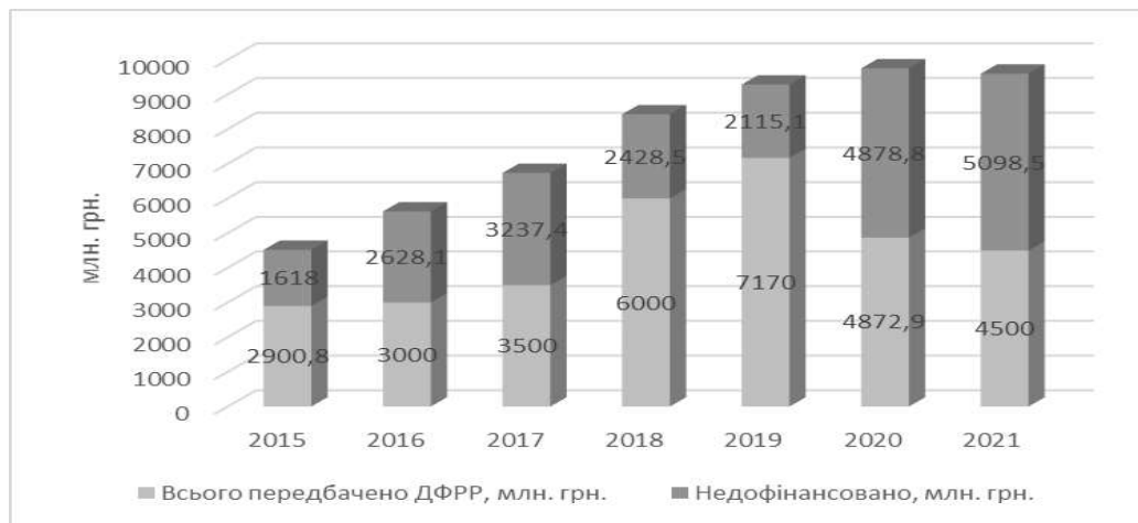
Рис. 1. Розрахунковий та фактичний обсяг ДФРР

На думку експертів, недофінансовану частину коштів перерозподіляють на фінансування непрозорих та політично мотивованих соціально-економічних субвенцій [6]. З 2017 р. додатковим джерелом фінансування ДФРР є спеціальний фонд державного бюджету.