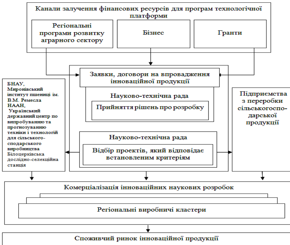
Рис. 2. Структура взаємодії учасників центру з розробки та впровадження інновацій

Особливої підтримки потребують ОСГ та ФСГ в частині навчання основам ведення аграрного бізнесу, забезпечення доступу до бази даних з придбання і використання виробничих ресурсів, реалізації продукції, сприяння обміну досвідом, вирішення юридичних і фінансових питань. Саме в цьому плані діяльність інформаційно-освітніх інноваційних центрів, буде досить ефективною (рис.2).