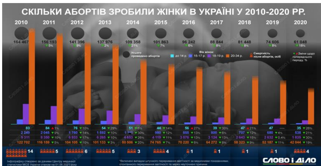
Мал.1. Кількість абортів за останні дев'ять років в Україні.

Жінки вдаються до штучного переривання вагітності не враховуючи його негативних наслідків, яким можуть: