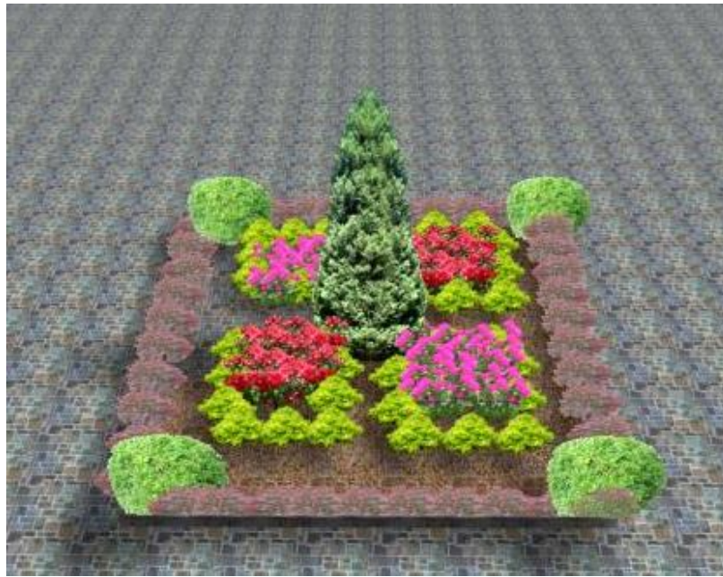
Рис. 1. Приклад парадної клумби біля «Торгових рядів БРУМ».

Таким чином, на нашу думку, використання хвойних і декоративно-листяних видів мінімізує догляд за насадженням із збереженням тривалого декоративного ефекту, що підтримуватиме колористику архітектурного ансамблю.