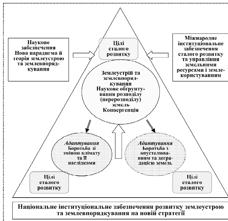
Рис. 2. Інституціональне забезпечення синергетичної моделі розвитку системи землепорядкування на засадах цілей сталого розвитку України

— розвиток (територіальне та внутрішньогосподарське планування) землекористування.