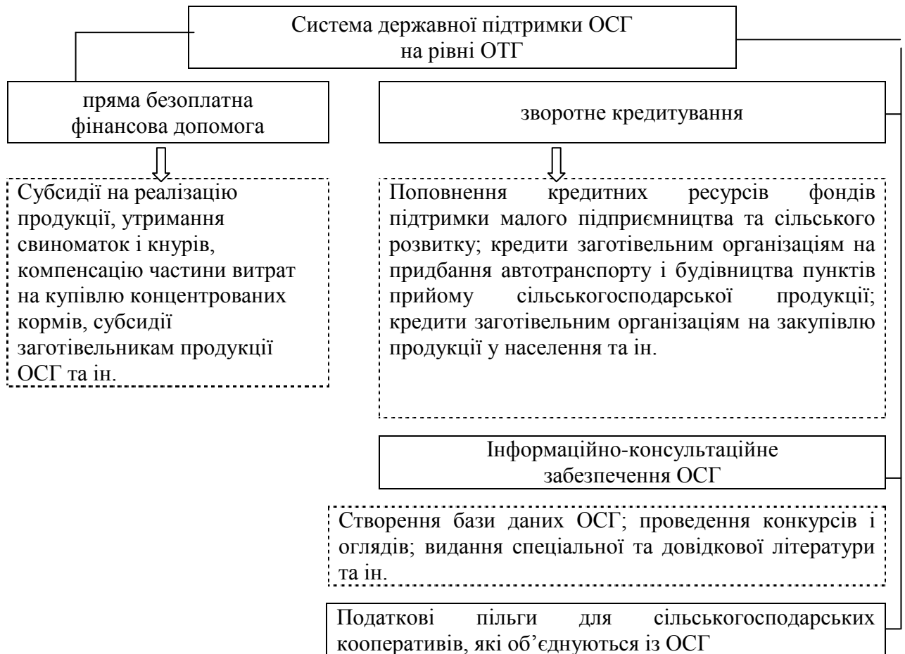
Рис. 2. Пріоритетні напрями державної підтримки функціонування особистих селянських господарств.