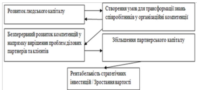
Рисунок 2 - Механізм стратегічного управління інтелектуальним капіталом організації

Існує ряд концепцій управління нематеріальними ресурсами організації, серед яких слід виділити роботи К. Свейбі, Роберта С. Каплана і Девіда П. Нортон, Г. Хемела і К. Прахалада, П. Сенге та ін. Тим не менш, на наш погляд, у сучасній літературі недостатньо глибоко досліджені питання руху інтелектуального капіталу, перетворення знань співробітників організації в фінансові результати. Нами запропонована концепція механізму стратегічного управління підприємством, що забезпечує сталий розвиток організації в умовах економіки знань (рис. 2). Основні ідеї концепції полягають у наступному: