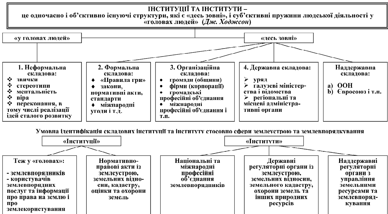
Рис. 1. Дефініція "Інституцій" та "Інституту" за Дж. Ходжсоном та авторське виділення загальних складових поняття "Інституція" та "Інститут" стосовно землеустрою та землевпорядкування

1) розширено організаційну інфраструктуру сталого розвитку;