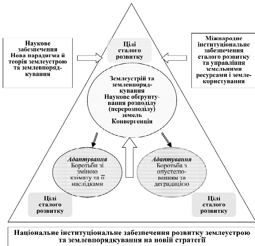
Рис. 3. Інституціональне забезпечення синергетичної моделі розвитку системи землевпорядкування на засадах цілей сталого розвитку України

Потужною ідеєю інституціональної мотивації розвитку землеустрою та землевпорядкування є цілі сталого розвитку. Вони формують модель розвитку земельного устрою України та систему сталого (збалансованого) землекористування від ідеології, що сформувалася в радянському союзі до ідеології інституцій і інститутів сталого розвитку. Останні мотивовані до конвергенційних процесів в землевпорядній сфері.