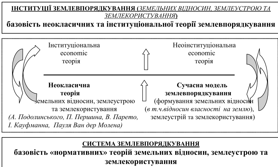
Рис. 1. Теоретичні складові зростання сутності землевпорядкування від "Системи" до "Інституції" (гіпотеза дослідження)

вих шкіл [5]. Формуючи філософську платформу розбудови інституціонально-поведінкової теорії землеустрою та землевпорядкування, ми врахували і сучасні тенденції практики та фундаментальні напрацювання наукових шкіл, які досліджують землеустрій та землевпорядкування від "замкнутої" інформаційно-технічної системи до вагомого явища національних та глобальних соціально-економічних просторів.