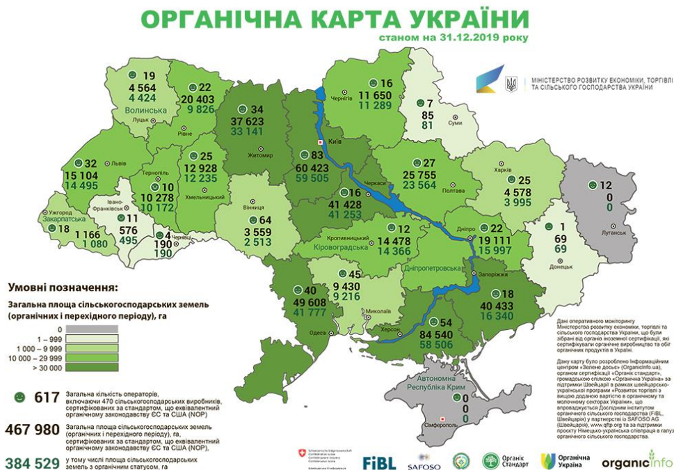
Рис. 2. Органічна карта України станом на 21.12.2019 р.

нараховувалось 617 операторів органічного ринку, з них 470 – сільськогосподарські виробники (рис.2).