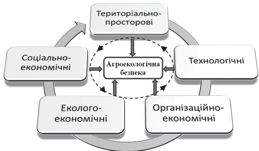
Рис. 1. Система чинників агроекологічної безпеки На схемі позначено зв'язки: — основні; — зворотні.