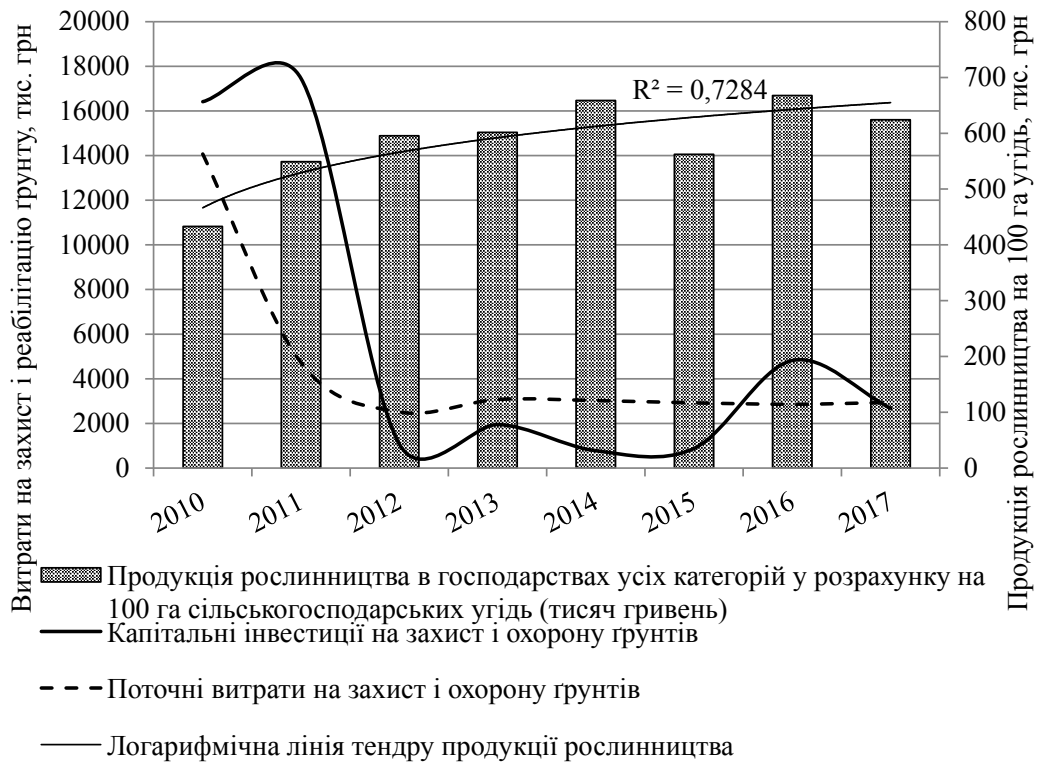
Рис. 1. Продукція рослинництва та витрати на захист і реабілітацію ґрунтів агроугідь Київської області, тис. грн