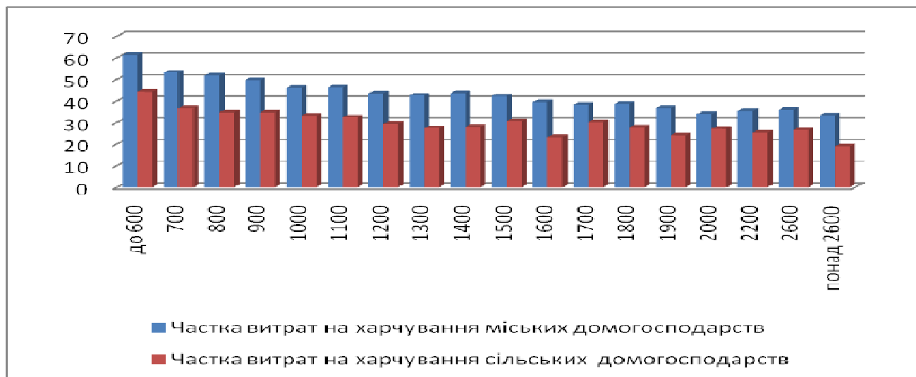
Рис. 2. Частка витрат на харчування міських і сільських домогосподарств залежно від рівня сукупних грошових доходів у 2009 р., %