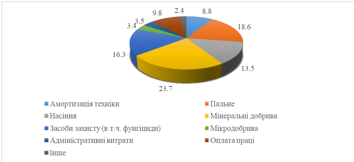
Рис. 1. Структура економічних витрат у технології вирощування буряків цукрових (середнє за 2020–2022 рр.), %.

Завдяки вищій урожайності коренеплодів максимальна вартість продукції була отримана за сумісного застосування фунгіцидів та мікродобрив – 78016,7–83286,7 грн/га і 88815,0–93671,7 грн/га, відповідно у гібридів Пушкін і Акація (табл. 1).