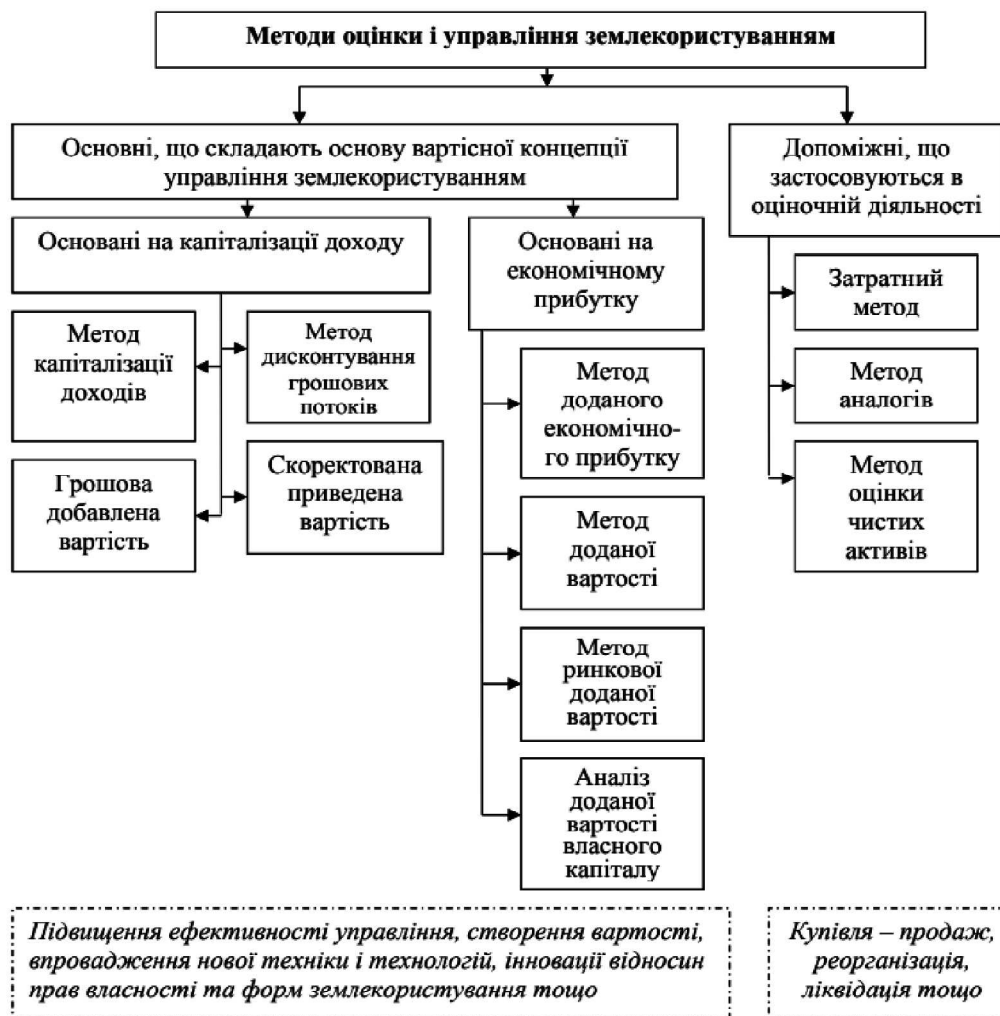
Рис. 2. Класифікація методів вартісної концепції