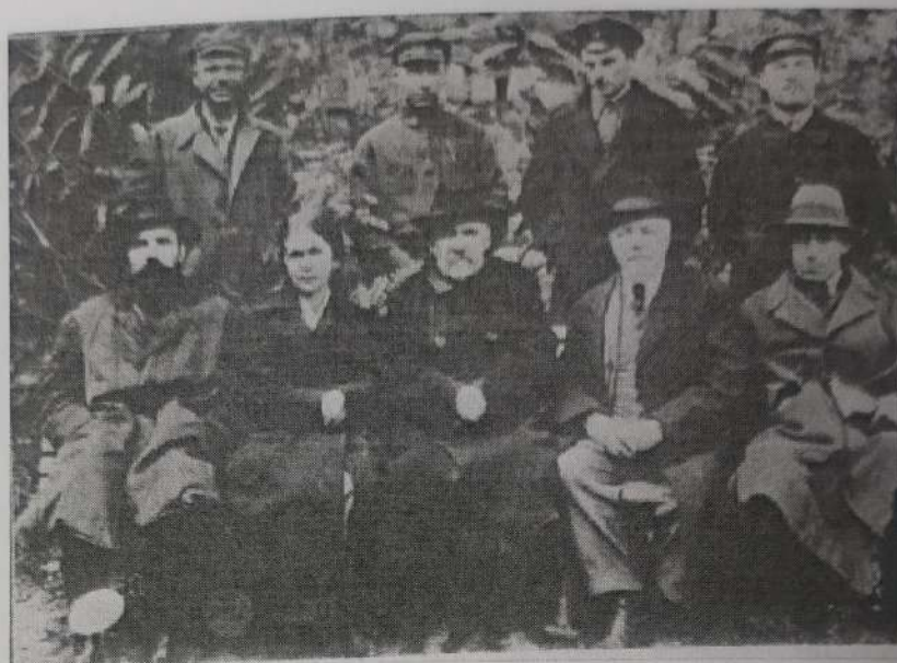
Кафедра ботаніки КСГУ 55