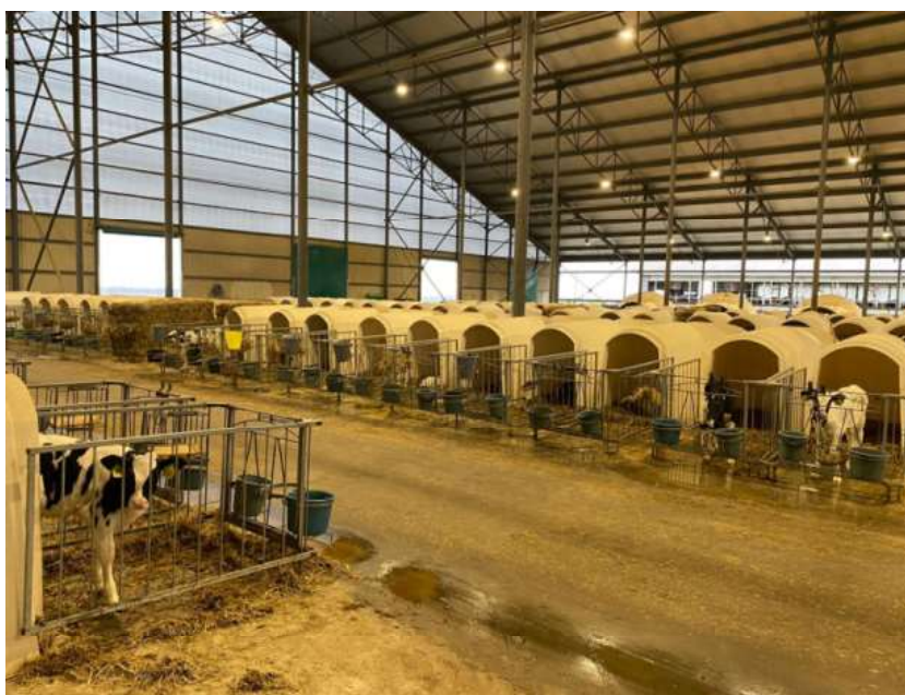
Рис. 1. Утримання телят в індивідуальних будиночках.

Із профілактичною метою в господарстві проводять обробку телят від протозоозів, зоокрема, криптоспоридіозу (Галокур) та еймеріозу (Еспакокс 5 %).