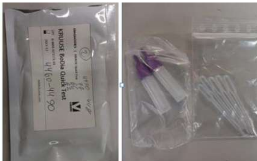
Рис. 3. Набір для проведення експрес-тесту «KRUUSE BoDia Quick Test».

Для встановлення етіотропного чинника захворювання із симптомом діареї проводили дослідження фекалій хворих телят за допомогою експрес-тесту «KRUUSE BoDia Quick Test» (рис. 3) та комбінованим методом стандартизованим Г.О. Котельниковим і В.М. Хреновим із використанням насиченого розчину нітрату амонію (дослідження наявності ооцист еймерій у полі зору мікроскопа).