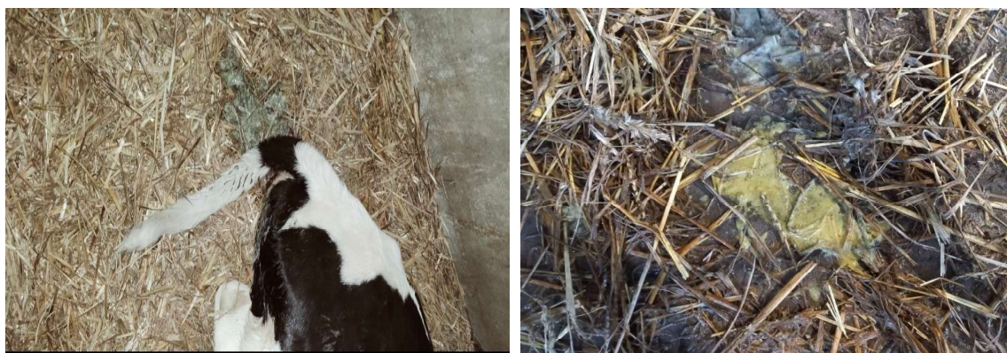
Рис. 5, 6. Вигляд фекалій від хворих телят.