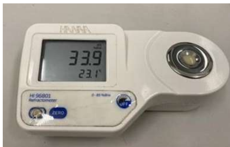
Рис. 4. Рефрактометр «HANNA».