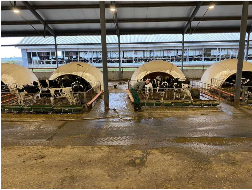
Рис. 2. Утримання телят в групових будиночках.

Діагноз захворювань, що супроводжувалися діареєю у телят встановлювали за результатами клінічних та гематологічних даних, копрологічних досліджень, позитивної реакції експрес-тесту «KRUUSE BoDia Quick Test» («Kruuse», Denmark).