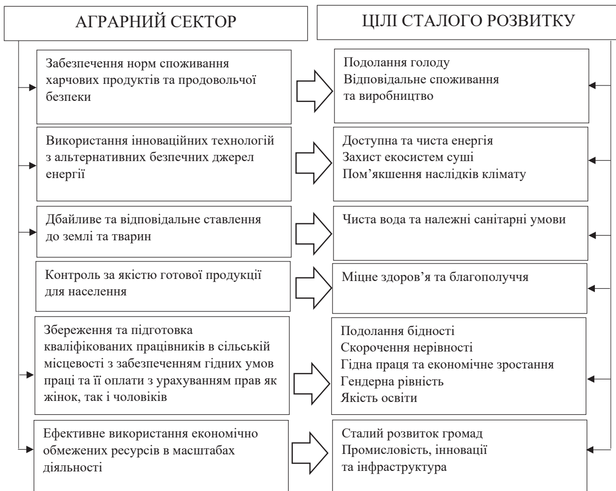
Рисунок 1 – Аграрний сектор економіки у забезпеченні цілей сталого розвитку

По-перше, один з найбільш відчутним ефектом є зменшення виробництва продукції. Обмежене використання хімічних добрив та пестицидів призводить до зниження урожайності та збільшення витрат на виробництво. Екологічні заборони вимагають від аграрних підприємств великих інвестицій у технології та інші ресурси, що негативно впливають на конкурентоспроможність сільськогосподарських виробників.